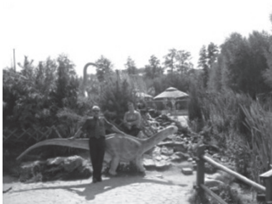
Rycina 1. Park Jurajski Bałtów