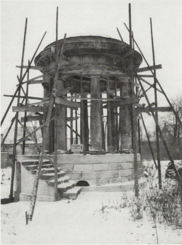
6. Monopter, zabezpieczenie kopuły — stan w grudniu 1995 r.