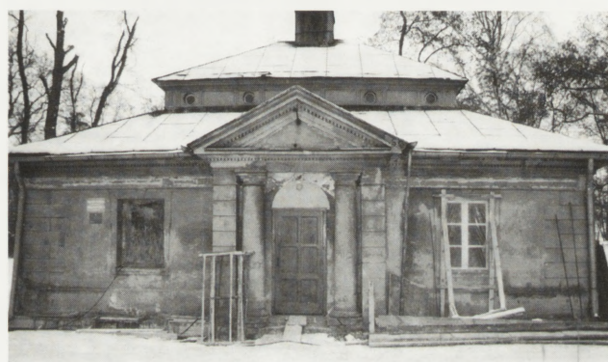
4. Oficyna — stan w grudniu 1995 r.