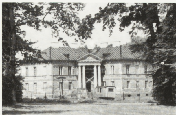
3. Pałac — stan w 1993 r.

Do 1939 r. rosło w parku 120 gatunków drzew i krzewów (dominowały gatunki iglaste). Obecnie powierzchnia parku obejmuje około 12 ha i pozostało na niej tylko około 40 gatunków. Przetrwowało jednak kilkanaście pomników przyrody. Są wśród nich platany, graby, jesiony, lipy i czerwonołiste buki. Do najważniejszych okazów należy ogromny platan, jeden z największych w Europie (ponad 10 m obwodu pnia). Został nasadzony przez Gorzeńskich w latach trzydziestych XVIII w., według legendy dla uczczenia Konstytucji 3 Maja poprzez tzw. wielokrotne nasadzenie, polegające w tym przypadku na umieszczeniu trzech sadzonek obok siebie, co po latach dało efekt olbrzymiego drzewa. Innym pomnikiem przyrody jest przepiękny paklon, klon polny, najstarszy i największy w Polsce, mający ponad 250 lat, rosnący pomiędzy oficyną i pałacem 5 .