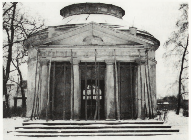
7. Panteon, zabezpieczenie portyku w grudniu 1995 r.