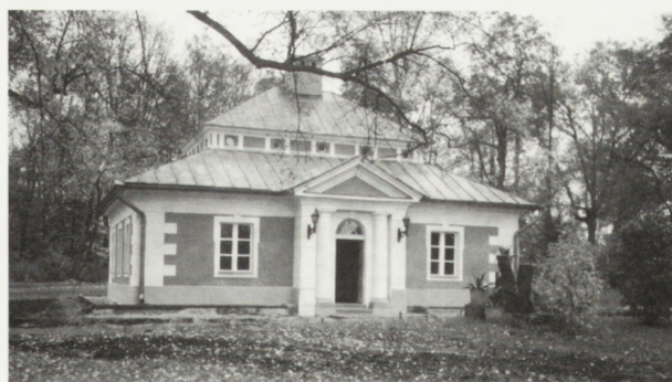
5. Oficyna po remoncie — listopad 1996 r.