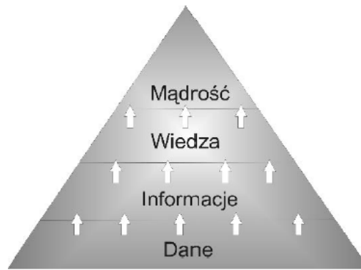
Rys. 1. Piramida mądrości

Jak twierdzi C. Cempel, na płaszczyźnie rozumienia siebie i świata, będącego istotnym składnikiem postępu, wiedza jest jedynym z ostatnich pięter, przed mądrością i powstaje z danych, by poprzez kolejne agregacje i połączenia dać informację, w dalszym ciągu tego samego procesu wiedzę, a na końcu mądrość [Zieliński 2009].