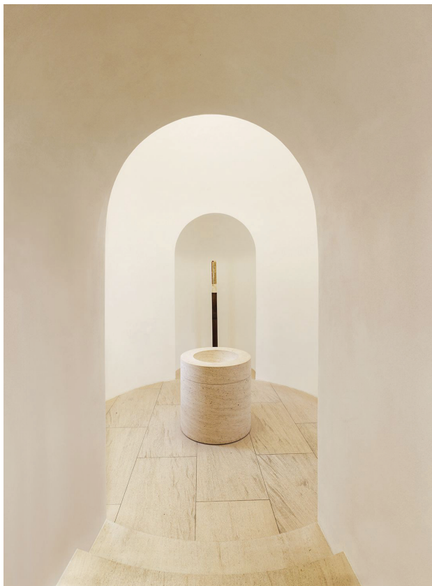
Il. 5. Kościół św. Maurycego, Augsburg, arch. John Pawson