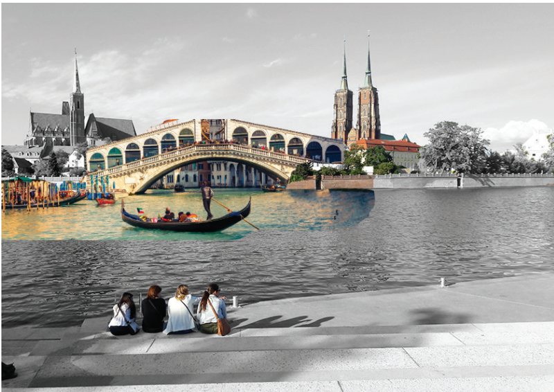
Kolaż autorstwa M. Anders Collage by M. Anders