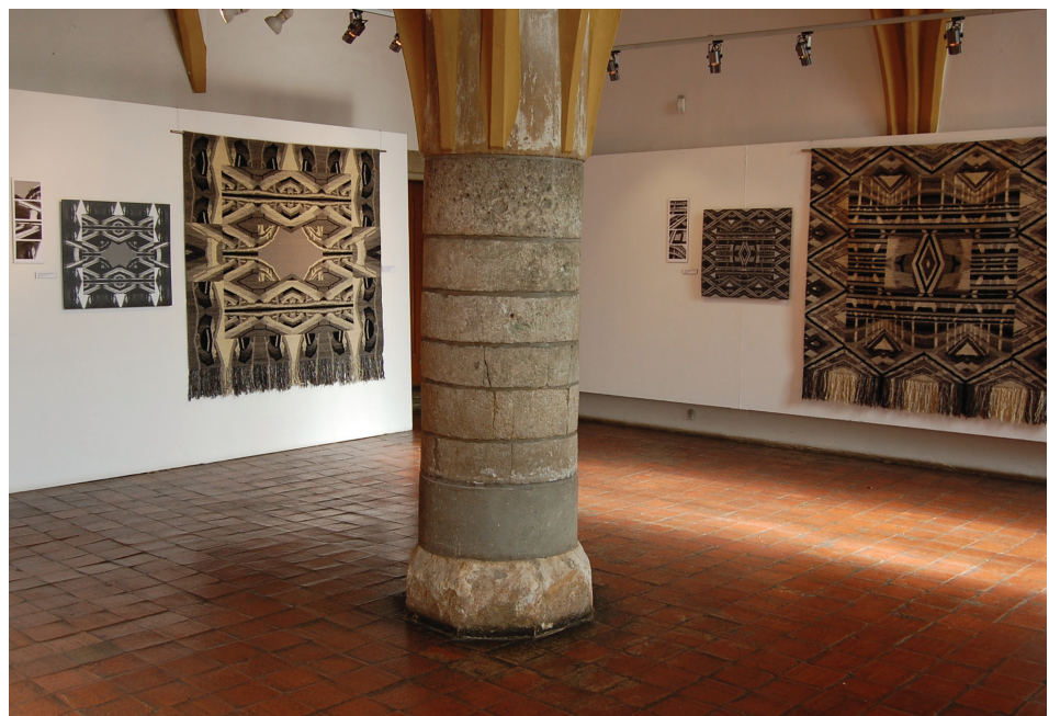
Fig. 7. Tadeusz Sawa-Borysławski, Archilims Poelzig II (on the left) and Poelzig I (on the right) at the exhibition in the Museum of Architecture in Wrocław, 2009