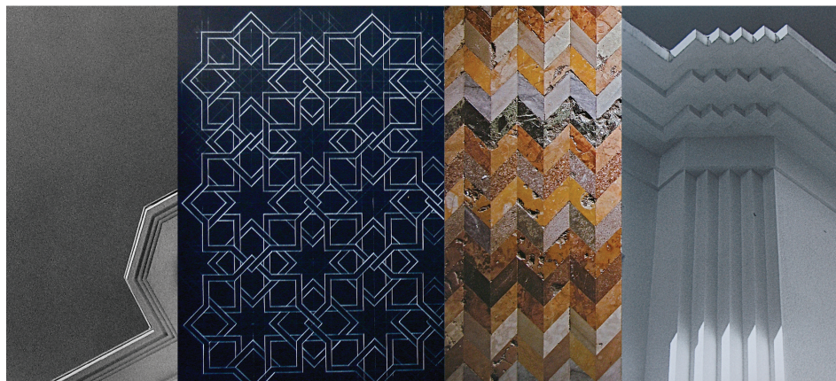
Fig. 4. Yannig Hedel, Venetian Suite , 2010

Miasta zakodowane w ich sterylnych wymkowych emblematkach nie tylko są ciche, one są także puste. Fotografie Galassiego i Hedela, podobnie jak niektóre obrazy Giorgia de Chirico, zniewalają nadrealną pustką. Tak więc i one są dalece niejednoznaczne. Niepokoją ze względu na niemożność zobaczenia tego, co sobą zakrywają, choć również relaksują, kiedy kontempluje się wybrane fotograficzne przedstawienie. Żeby jednak osiągnąć stan wyciszenia, trzeba patrzeć bez świadomego widzenia: patrzeć na samą czystą wizualność obrazu, unikając jakiegokolwiek znaczeniowej jego interpretacji.