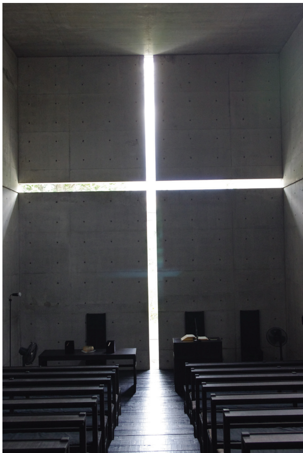
Il. 8. Kościół światła, arch. Tadao Ando