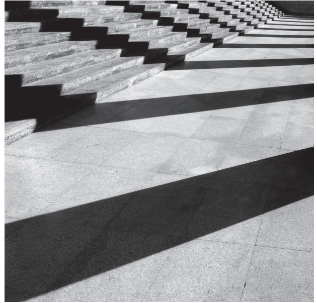
Il. 2. Gianni Galassi, Pałac Kongresu w Rzymie (arch. A. Libera)

Francuski fotograf z upodobaniem utrwała swoim aparatem puste płaszczyzny. Są na ogół jednolicie szare, w tonacji takiej samej jak zmierzchające bezchmurne