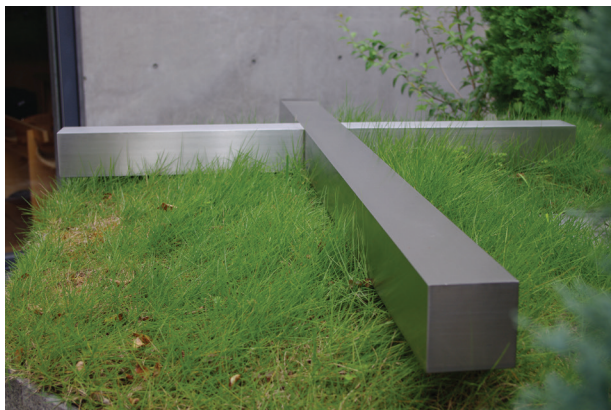
Il. 9. Kościół światła, krzyż, arch. Tadao Ando (fot. J. Olek)

W wyrafinowanej prostocie projektów Ando, której twórczość spełnia się na styku międzynarodowego modernizmu i estetycznych kanonów sztuki Dalekiego Wschodu, na plan pierwszy wybija się ściana, będąca głównym elementem modelowania przestrzeni. Repertuar