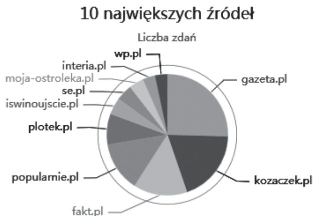
Wykres 2. Dziesięć największych źródeł, w których występuje leksem słodziak (wyszukiwarka monco.frazeo.pl. wykres wygenerowany 28 stycznia 2018).

Także analiza źródeł pozwala na wyciągnięcie wniosków dotyczących leksemu słodziak . Wyszukiwarka korpusowa monco.frazeo.pl pozwala na wygenerowanie diagramu ze źródłami, w których dany leksem pojawia się najczęściej. Oto diagram dla leksemu słodziak :