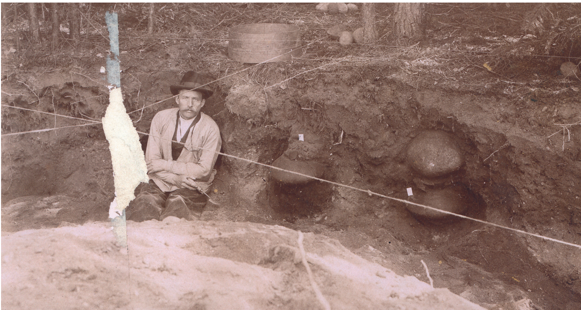
Ryc. 3. Zdjęcie nr XII z wykopalisk w Gąsiorze, pow. piski (dawn. Gąsior-Jaskowska-See, Kr. Sensburg ), w sierpniu 1906 roku. W tle obiekty 218 i 221 (PM-A 390, Bl. 13)