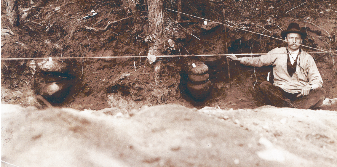
Ryc. 2. Zdjęcie nr XI z wykopalisk w Gąsiorze, pow. piski (dawn. Gąsior-Jaskowska-See, Kr. Sensburg ), w sierpniu 1906 roku. W tle obiekty 216, 219 i 220 (PM-A 390, Bl. 18)