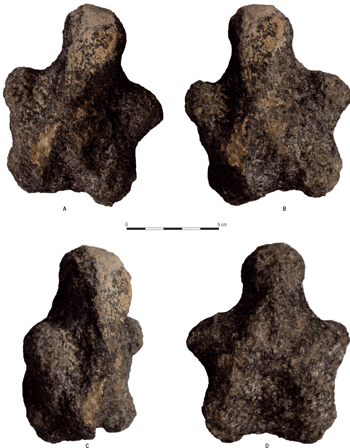
Ryc. 2. Tup a d ł y, stan. 1, pow. Inowrocław. Figurka kamienna. A, B, C – awers, D – rewers. Fig. 2. Tup a d ł y 1, Inowrocław County. Stone figurine. A, B, C – face, D – revers.

kające z badań petrograficznych wskazują raczej na lokalne pochodzenie surowca, co również wskazywałoby na miejscowe wykonanie figurki.