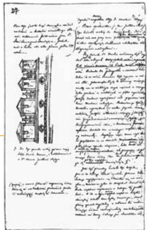
4. Brulion Lubelski , drawing of an attic in the Holy Ghost Hospital in Lublin, p. 27. Archive in Piotrków.