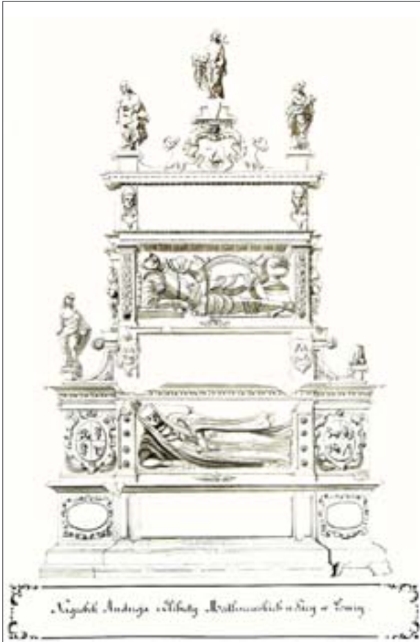
26. Łomża, nagrobek Andrzeja i Elżbiety Modliszewskich w farze (ob. katedrze), rys. D. Jastrzębowski, 1851, Atlas VII. Gubernia Augustowska , tabl. 50. Gab. Ryc. BUW.

26. Łomża, gravestone of Andrzej and Elżbieta Modliszewski in the parish church (today: cathedral), drawing: D. Jastrzębowski, 1851, Atlas VII. Gubernia Augustowska (Atlas VII. Augustów Gubernia), table 50. Gab. Ryc. BUW.