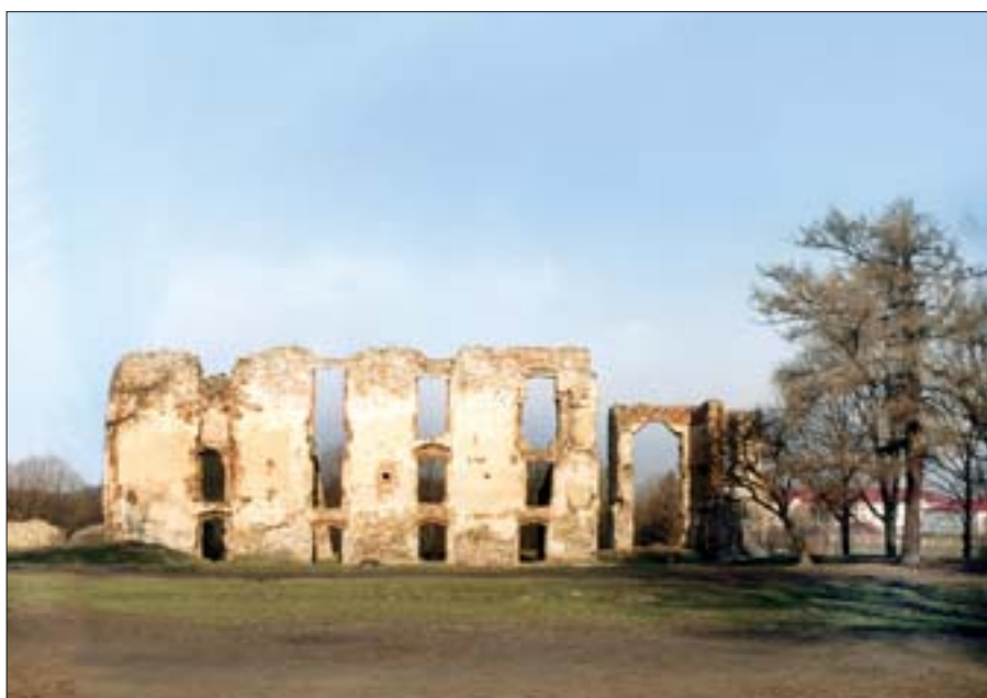
11. Bodzentyn, zamek biskupów krakowskich. Fot. J. Mróz, 2003 r.