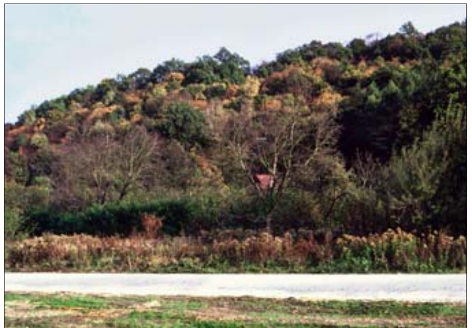
25. Kazimierz Dolny. Teren na przedmieściu Janowieckim, gdzie stał spichlerz „Pod Bożą Męką”. Fot. P. Maciuk, 2002 r.