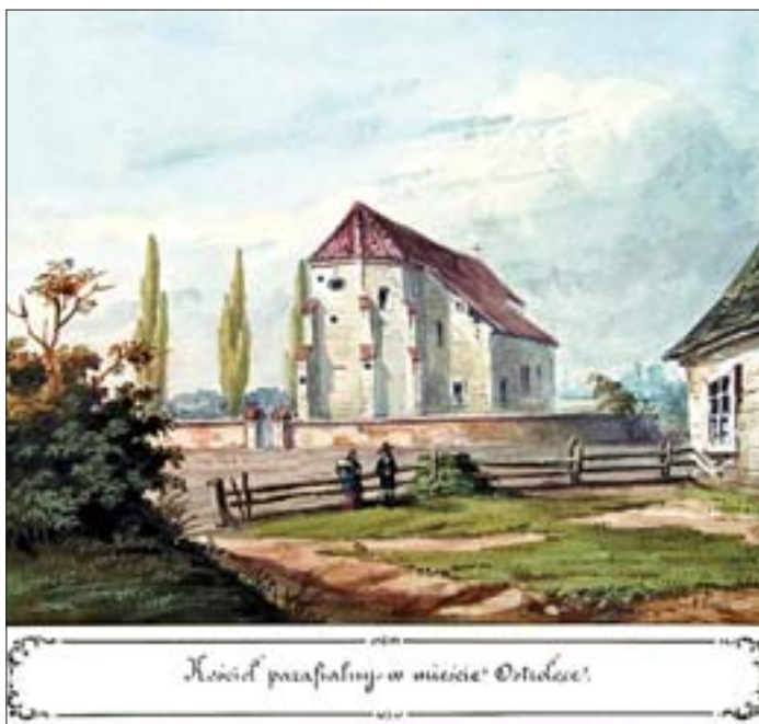
Кościół parafialny w mieście Ostrołęce.

18. Ostrołęka, kościół parafialny, rys. A. Lerue, 1851, Atlas IV. Gubernia Płocka , tabl. 71. Gab. Ryc. BUW.