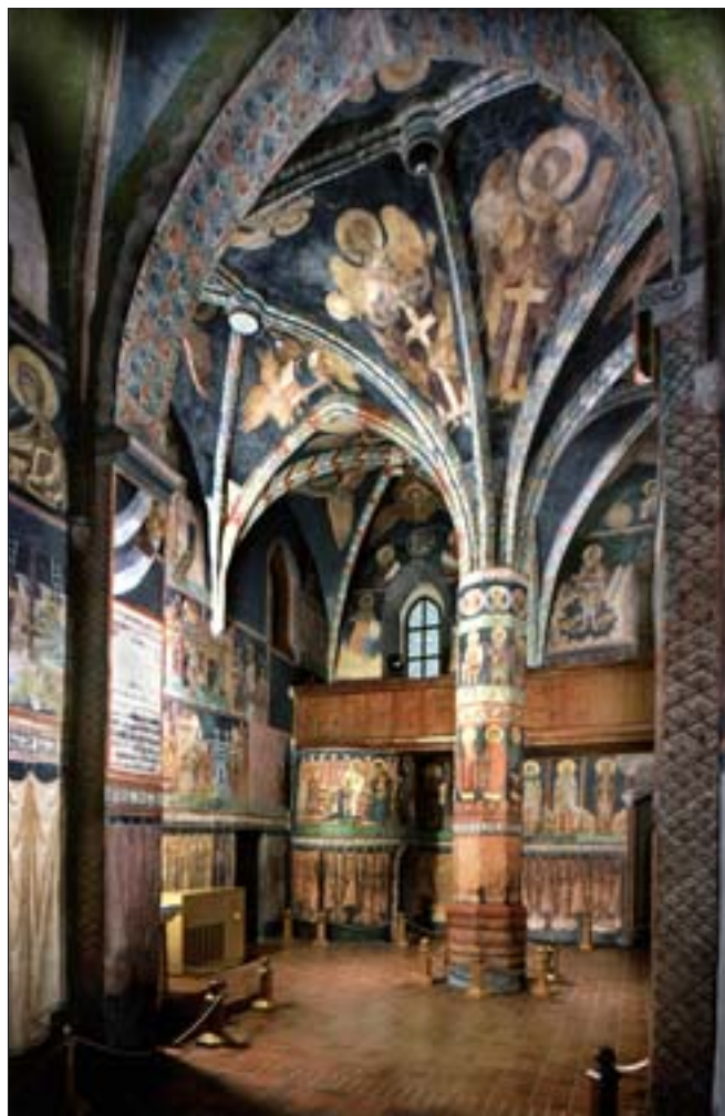
23. Lublin, wnętrze kaplicy zamkowej Świętyw Trójcy. Fot. P. Maciuk, 2001 r.

Na początku trzeba było jednak uzyskać pozwolenie kurii biskupich na przeprowadzenie wizji