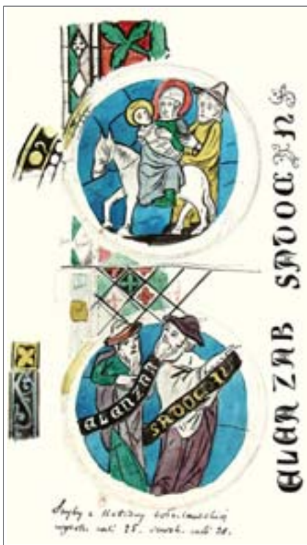
3. Rysunek witraży w katedrze we Włocławku w Pamiętniku Kazimierza Stronczyńskiego, s. 55. Gab. Ryc. BUW.

W okresie powojennym, dzięki zbiorowemu wysiłkowi historyków sztuki, a przede wszystkim Instytutowi Sztuki Polskiej Akademii Nauk, inwentaryzacja zabytków w Polsce była kontynuowana. Obecnie zbliża się ku końcowi. Zaistniały więc warunki do pełnej oceny dzieła, dokonania