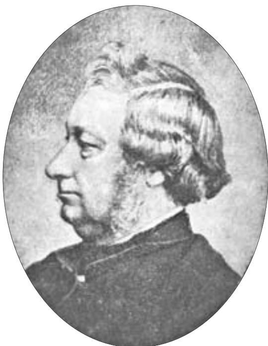
1. Kazimierz Stronczyński na fotografii z ok. 1855 r. 1. Kazimierz Stronczyński in a photograph from about 1855.

Dopiero po 150 latach od zakończenia prac nad wielką inwentaryzacją zabytków starożytności w Królestwie Polskim, powadzonych przez Kazimierza Stronczyńskiego, podjęliśmy kompleksowe opracowanie tego monumentalnego dzieła, szczęśliwie zachowanego w Gabinecie Rycin Biblioteki Uniwersyteckiej w Warszawie 1 . Składa się ono z 5 tomów opisów zabytków i 7 atlasów z widokami zabytków malowanych akwarelą. Ta wielka praca została wykonana w latach 1844-1855 przez Delegację Komisji Rządowej i jej kierownika Kazimierza Stronczyńskiego, przy udziale archiwistów i malarzy. Obecnie prowadzone są przygotowania do jej publikacji w pełnej wersji, obejmującej tekst źródłowy i ilustracje.