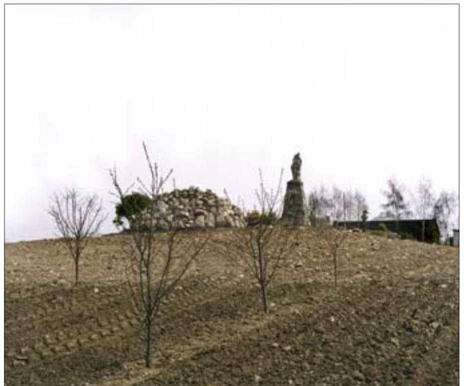
13. Chalno, miejsce po kościele filialnym norbertanów. Fot. M. Rogowska, 2003 r. 13. Chalno, site of a Premonstratensian filial church. Photo: M. Rogowska, 2003.