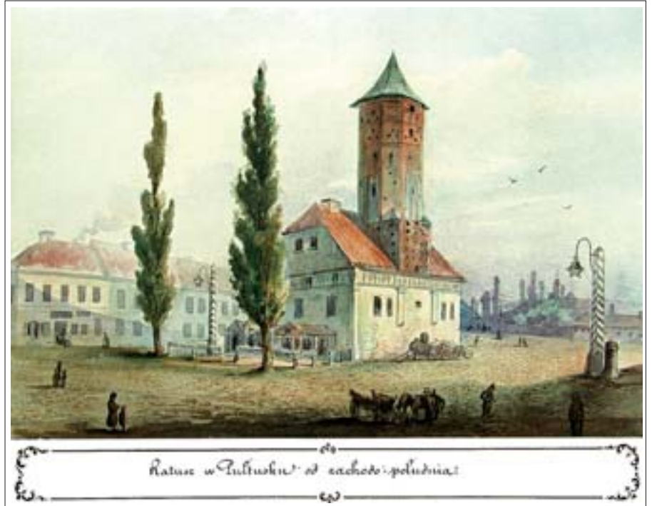
20. Pultusk, ratusz, (1405-1728), rys. 1844-1846. Atlas V. Gubernia Płocka, tabl. 25.

Powyższy przegląd obrazuje, jak wielkim i skomplikowanym przedsięwzięciem stało się dokumentowanie historycznej inwentaryzacji pisanej i ikonograficznej Kazimierza Stronczyńskiego oraz opracowanie komentarzy i sporządzenie porów-