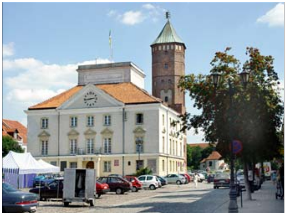
21. Pultusk, ratusz. Fot. K. Kaliściak, 2003 r.