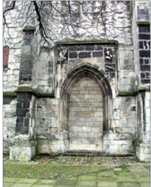
9. Wiślica, portal boczny w kolegiacie. Fot. W. Siudowski, 2003 r.

8. Wiślica, side portal in the collegiate church, drawing: T. Chrząński, 1844-1846, Atlas I. Gubernia Radomska (Atlas I. Radom Gubernia), table 58. Gab. Ryc. BUW.