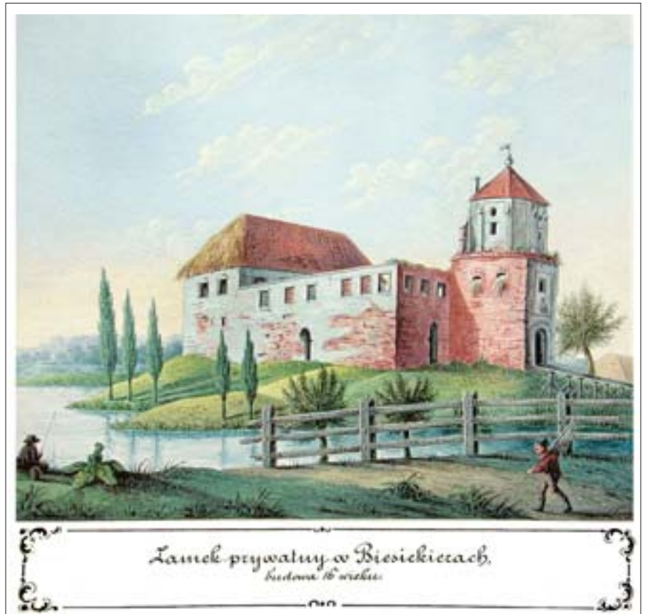
16. Besiekiery, zamek, 1844-1846, Atlas III. Gubernia Warszawska, tabl. 32.

Objazdy terenowe, oględziny zabytków i fotografowanie odbywało się za zezwoleniem wojewódzkich konserwatorów