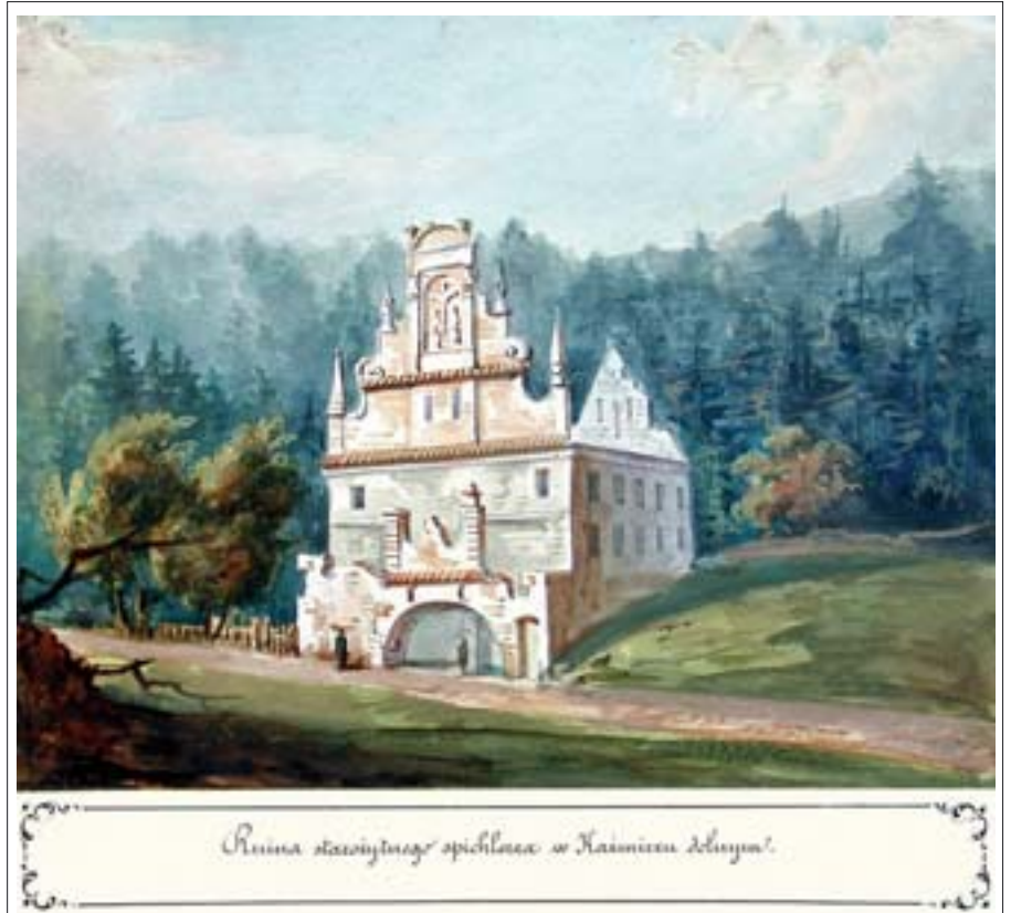
24. Kazimierz Dolny, spichlerz „Pod Bożą Męką”, rys. 1852-1853. Atlas VI. Gubernia Lubelska , tabl. 38. Gab. Ryc. BUW.