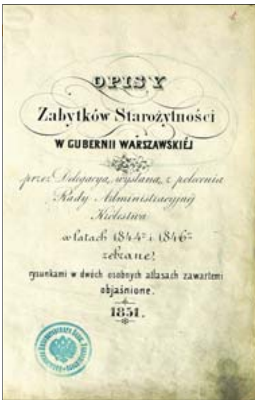
5. Karta tytułowa Opisów Zabytków Starożytności w Gubernii Warszawskiej , 1851 r. Gab. Ryc. BUW.

5. Title page of Opisy Zabytków Starożytności w Gubernii Warszawskiej (Descriptions of Antiquities in the Warsaw Gubernia), 1851. Gab. Ryc. BUW.