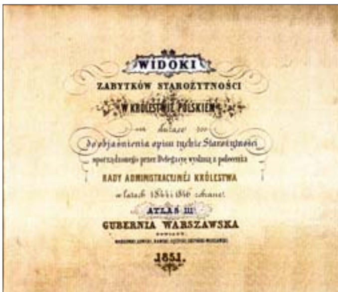
7. Karta tytułowa Widoków Zabytków Starożytności w Królestwie Polskim. Atlas III. Gubernia Warszawska, 1851 r.