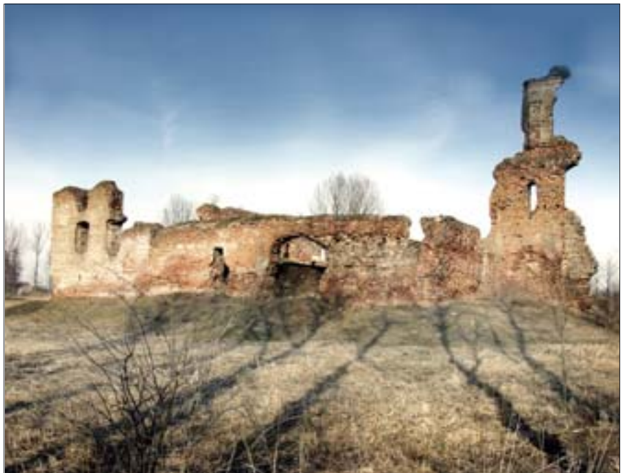
17. Besiekiery, zamek. Fot. W. Stepień, 2003 r.