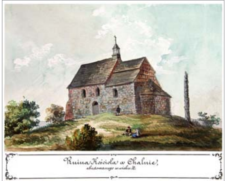
12. Chalno, kościół norbertanów (filialny), rys. 1844-1845, Atlas III. Gubernia Warszawska, tabl. 46.