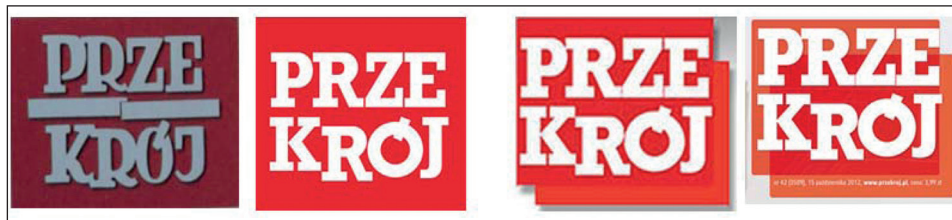
Rys. 3. Zmiany logotypu „Przekroju” w latach 2002, 2008 i 2012

mniej w layoutcie „Przekroju” było wcześniejszej oryginalności, niezwykłości i nieuporządkowania. Pod koniec 2002 roku zmienił się także logotyp pisma.