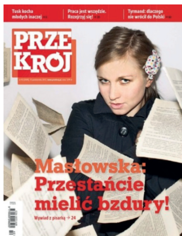
Rys. 5. Projekt okładki i logotypu M. Piwowar