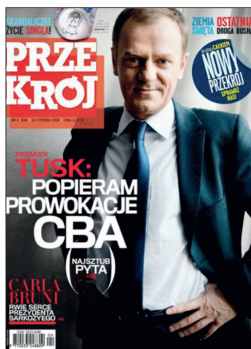
Rys. 4. Pierwszy numer „Przekroju” po zmianie szaty graficznej w 2008 r. Źródło: „Przekrój” 2008, nr 4, za: Nowy „Przekrój” pod lupa ekspertów, http://www.wirtualnemedial.pl/arttykul/nowy-przekroj-pod-lupa-ekspertow [dostęp: 6.06.2014].