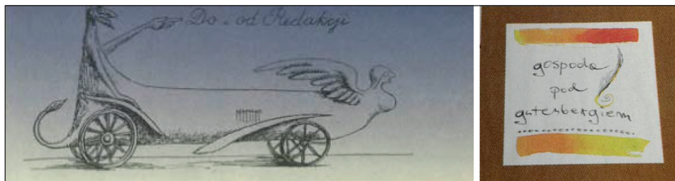
Rys. 2. Przykłady kroju pisma stylizowanego na odręczne – rubryki: „Do i od Redakcji” i „Gospoda pod Gutenbergiem”

Szata graficzna „Przekroju” z 2000 roku wyglądem przypominała bardziej gazetkę zakładową niż ogólnopolski tygodnik, ale nadawała pismu wyjątkowy charakter, podobnie jak duża liczba rysunków satyrycznych. Uwagę zwracał również krój pisma stylizowany na odręczny.