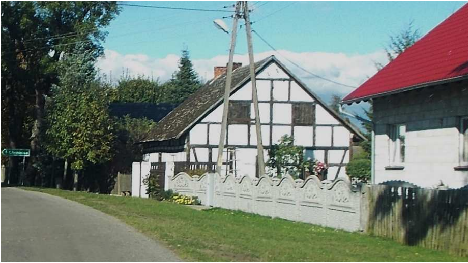
Fot. 8. Dom z II poł. XX wieku we wsi Boruja, gm. Siedlec