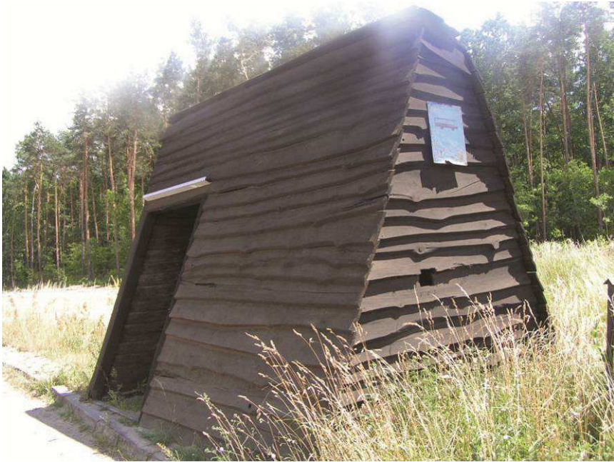
Fot. 7. Wiata przystankowa w Jeziercach, gm. Skoki

Warto w tym miejscu przytoczyć interesującą inicjatywę władz gminy Skoki w powiecie wągrowieckim, które zrealizowały serię wiat przystankowych (fot. 7), które formą nawiązują do obiektów wchodzących w skład przebiegającego przez gminę „Szlaku kościołów drewnianych wokół Puszczy Zielonka”. Obiekty te dzięki swojej kolorystyce oraz użytym materiałom, doskonale wpisują się w naturalny wiejski krajobraz.