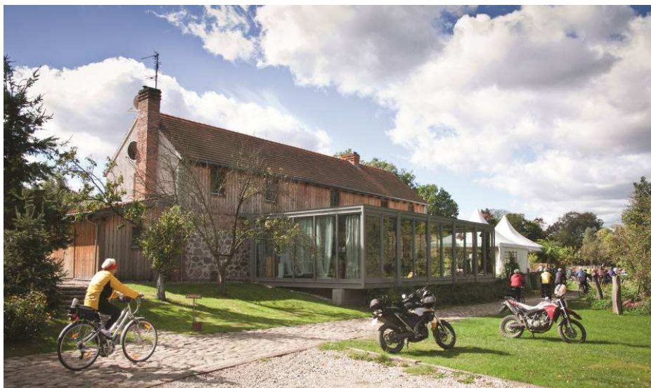
Fot. 5. „Hotelik Rozmaitości” w Pławnie k. Murowanej Gośliny