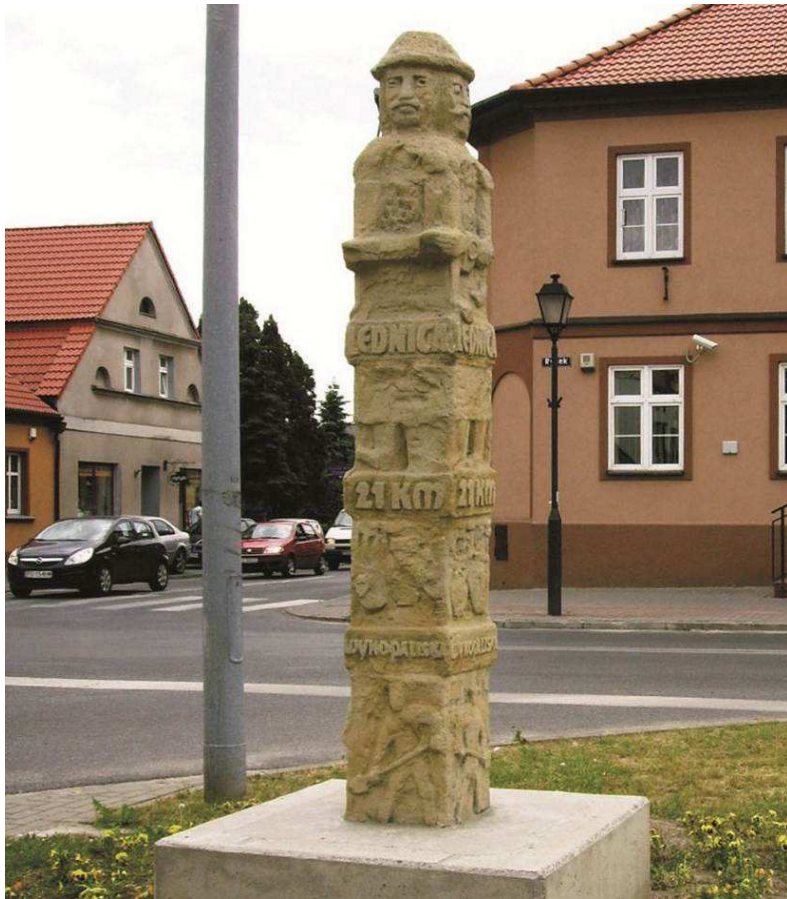
Fot. 3. Słup Światowida w Kostrzynie k. Poznania