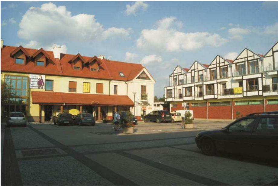
Fot. 1. Nowy Rynek w Puszczykowie

Zdarza się, że problemy przestrzenne wynikają z ambicji władz lokalnych, które za wszelką cenę próbują podnieść prestiż swoich miejscowości, realizując często zbyt pośpiesznie i bez odpowiedniego przygotowania inwestycje, które w efekcie są błędne pod względem urbanistycznym oraz w niewystarczający sposób odwołują się do tradycyjnej architektury miejsca lokalizacji. Przykładem takiej inwestycji może być wybudowany od podstaw w 2010 roku Nowy Rynek w Puszczykowie (fot. 1), którego realizacja wynikała z uzasadnionej chęci utworzenia przestrzeni publicznej integrującej mieszkańców. Niestety, nowe założenie nie zostało właściwie włączone w istniejącą tkankę urbanistyczną miejscowości, lecz sztucznie oddzielone pasem nowej zabudowy od głównej ul. Poznańskiej. Poza tym wątpliwości wzbudza jakość architektoniczna niektórych budynków oraz zasadność wydzielenia prawie \frac{1}{3} powierzchni rynku jako przestrzeni parkingowej.