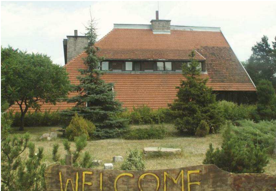
Fot. 2. Zajazd Rzepicha w Promnie-Stacji k. Pobiedzisk

Próby stymulacji rozwoju nie tylko przestrzennego, ale także gospodarczego i społecznego w oparciu o rozbudowę infrastruktury turystycznej inspirowanej tradycyjną architekturą były na terenie Wielkopolski podejmowane w przeszłości. Najbardziej znanym przykładem takich inwestycji (które ze względu na odwołania do tradycyjnych form lokalnych świetnie wpisują się w otoczenie) są tzw. gościńce wielkopolskie. Widoczny na fot. 2 zajazd Rzepicha, wybudowany w 1974 roku w niewielkiej miejscowości Promno-Stacja na zachód od Pobiedzisk, był jednym z 33 gościńców zrealizowanych w Wielkopolsce w latach 70. XX wieku według typowego projektu Jana Kopydłowskiego i Jerzego Buszkiewicza. Architektura wszystkich budynków nawiązuje do staropolskich zajazdów i karczm (z których w Wielkopolsce zachowały się do chwili obecnej 23 takie obiekty).