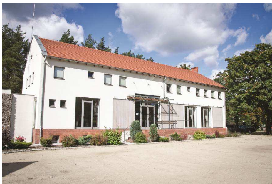
Fot. 6. Budynek konferencyjny w Kamińsku k. Murowanej Gośliny