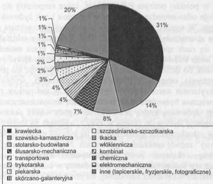
Rys. 2. Spółdzielnie w układzie branżowym (maj 1947 r.)