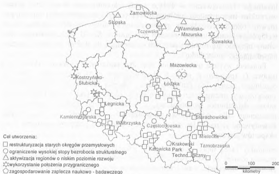
Rys. 2. Cele powołania specjalnych stref ekonomicznych w Polsce