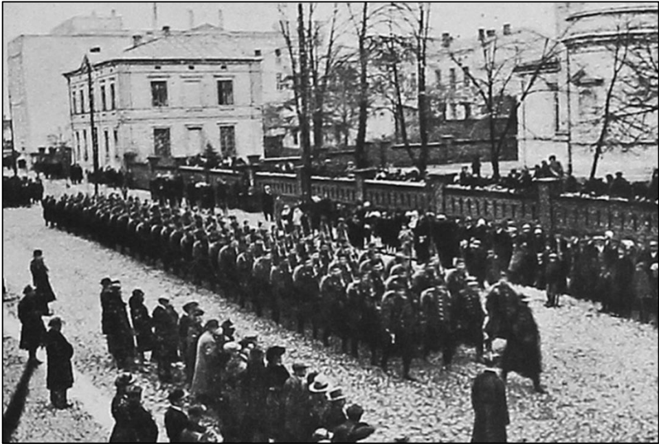
2. Defilada Batalionu Podchorążych Rezerwy Piechoty nr 4 ulicą POW w Tomaszowie Mazowieckim latem 1928 r.