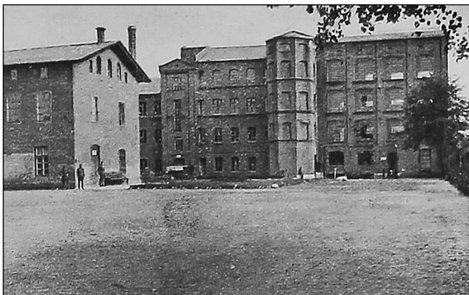
1. Widok koszar przy ul. Jeziornej 20 w Tomaszowie Mazowieckim z 1928 r.