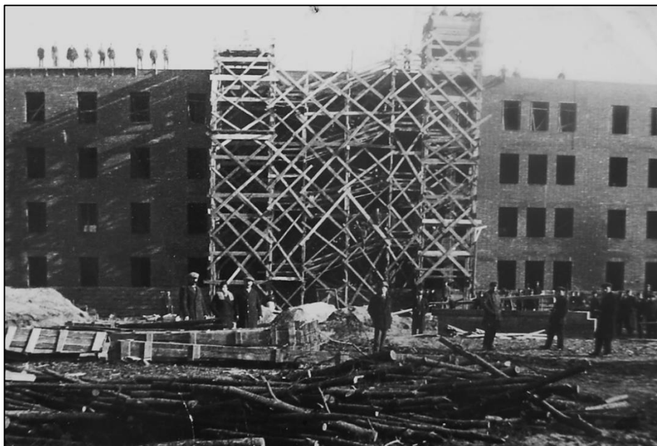
4. Budowa koszar dla II dywizjonu 4. pac w Tomaszowie Mazowieckim, wiosna 1935 r.

w styczniu 1930 r., gdy ujednolicono uzbrojenie baterii. Odtąd I i II dywizjon 4. pac liczył po dwie baterie haubic 155 mm wz. 17, a III dywizjon – dwie baterie armat 105 mm wz. 13 (potem wz. 29). W 1932 r. wprowadzono także nowy pokojowy etat pułku, w myśl którego miał liczyć 42 oficerów, 783 szeregowych i 341 koni 43 .