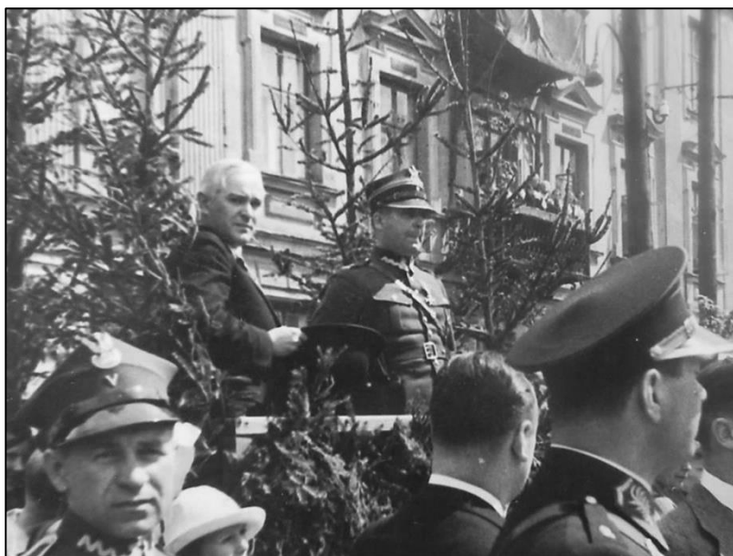
8. Podpułkownik Jan Szuster na trybunie honorowej na placu Tadeusza Kościuszki w Tomaszowie Mazowieckim, około 1938/1939 r.

wa objęła w OK IV skierniewicką 26. Dywizję Piechoty i stacjonującą w Tomaszowie Mazowieckim II dywizjon 4. pac (dywizjon był zaliczony do tzw. jednostek czarnych, co oznaczało, że w czasie pokoju był przewidywany do zadań o charakterze interwencji specjalnej lub – jak to było w tym przypadku – do osłony zagrożonej granicy państwowej) 55 . Istniejący w czasie pokoju 4. pac miał w trakcie mobilizacji – podobnie jak pozostałe pułki artylerii ciężkiej – ulec likwidacji, a na jego bazie planowano sformować kilka nowych jednostek. Jedynie II dywizjon nie został przeformowany, lecz rozbudowany do etatu wojennego przewidującego trzy baterie. Dywizjon miał osiągnąć gotowość marszową w ciągu 60 godzin od rozpoczęcia mobilizacji, czas ten dla 4. baterii określono na 32 godziny, dla 5. baterii – na 40 godzin, dla dowództwa dywizjonu – na 48 godzin, a dla nowo sformowanej 6. baterii i kolumny amunicyjnej dywizjonu – na 60 godzin 56 .