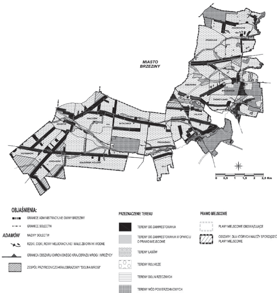
Rys. 3. Fragment Studium uwarunkowań i kierunków zagospodarowania przestrzennego gminy Brzeziny dotyczący doliny rzeki Mrogi