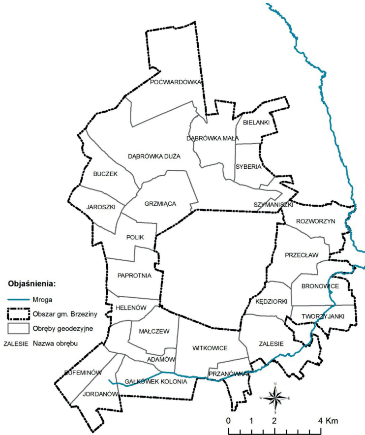
Rys. 1. Rzeka Mroga w przestrzeni gminy Brzeziny