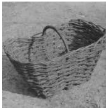
Ryc. 2. Koszyki o dnie płaskim owalnym