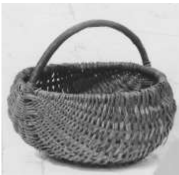
Ryc. 1. Koszyki półkuliste