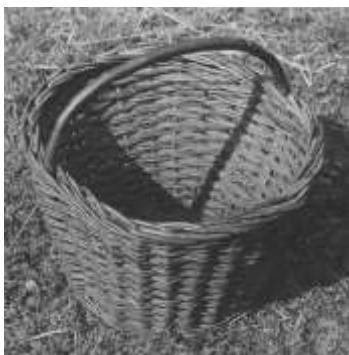
Ryc. 3. Koszyki o dnie kolistym płaskim