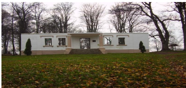
Fot. 3. Amfiteatr urządzony w odrestaurowanej części dworu ostatniego dziedzica Czerniewic, Adolfa Buchowieckiego.