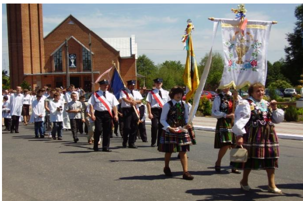
Fot. 2. Panie z RGKGW w rawskim stroju ludowym, podczas procesji Bożego Ciała 7. czerwca 2007 roku.