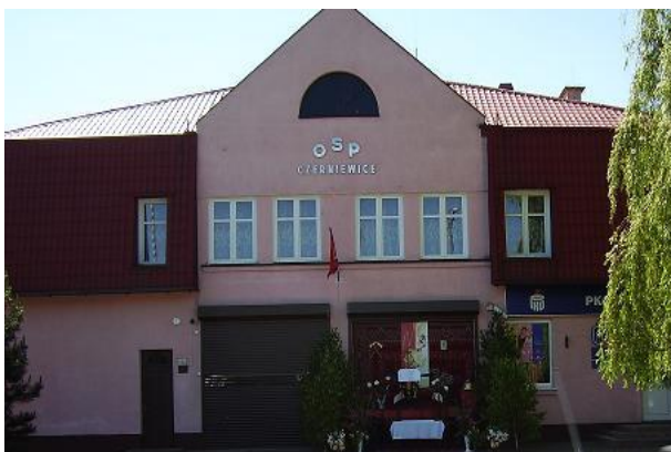
Fot. 1. Ochotnicza Straż Pożarna w Czerniewicach. Ołtarz przystrojony przez druhową w Boże Ciało. (P. a. a).