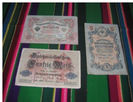
Fot. 4. Fragmenty wystawy w Izbie Pamięci przy GOK.