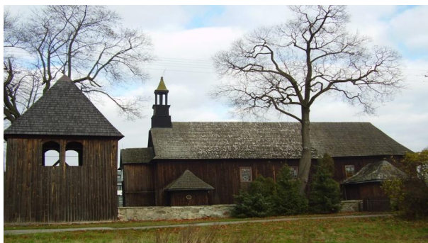
Fot. 3. Zabytkowy kościółek modrzewiowy w Czerniewicach. dnia 10.10. 2007 r.