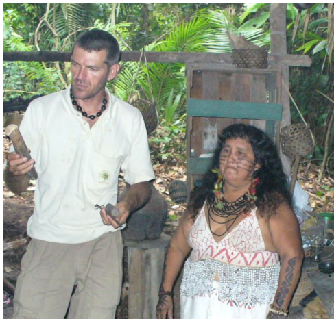
Ryc. 7. Szamanka Sateré-Maué z wioski nad rzeką Ariaú wraz z przewodnikiem-tłumaczem