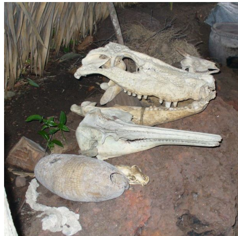
Ryc. 8. Obiekty kultu szamańskiego Sateré-Maué