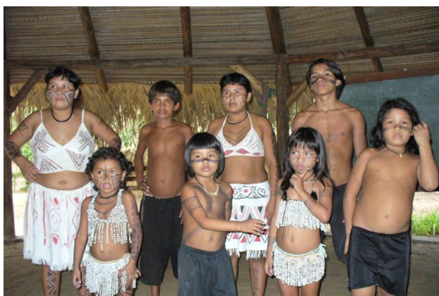
Ryc. 10. Pokaz tradycji plemiennych w wiosce Sateré-Maué