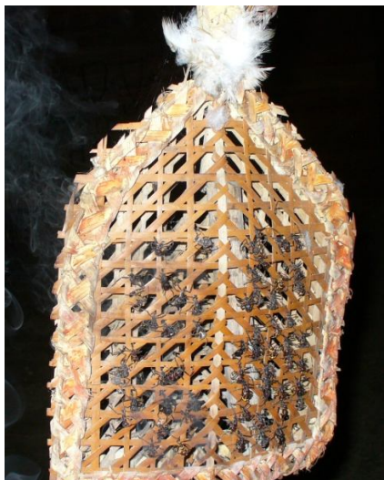
Ryc. 5. Rękawice z mrówkami używane do rytuału inicjacji przez plemię Sateré-Maué

Festiwal Tocandira pokrywa się ze zbiorami guarany, obejmując co najmniej 20 dni tego okresu (Tate 2010). Podczas festiwalu odbywa się drugi – obok produkcji guarany – rytuał, z którego słynie plemię Sateré-Maué i który niezadko staje się tematem doniesień żadnych sensacji tabloidów (Wright 2012). Jest to rodzaj „pasowania”, obrzęd wprowadzający młodych chłopców w wieku ok. 12 lat w dorosłość (Masters 2013). Rytuał należy do najbardziej okrutnych, nawet jak na warunki Amazonii. Na obie ręce chłopca zakłada się wyplatane ze słomy, prostokątne rękawice, malowane ciemnoniebieskim barwnikiem z rośliny genipa, przybrane piórami jastrzębia i papugi, które przywiązuje się do przedramienia na ok. 10 minut. Rękawice są wypełnione kilkunastoma mrówkami z gatunku Paraponera clavata , popularnie zwanymi „mrówką pociskową” lub „24-godzinna”, gdyż ich ugryzienie ma moc uderzenia pocisku z broni palnej, a ból utrzymuje się przez dobę (Botelho, Weigel 2011) (ryc. 5). Podczas tego rytuału przejścia od dzieciństwa do dorosłości, które ma ogromne znaczenie w mitologii Sateré-Maué, wykonuje się pieśni o treściach sławiących pracę, miłość i odnoszących się do wojny ( Sateré Mawé 2012).