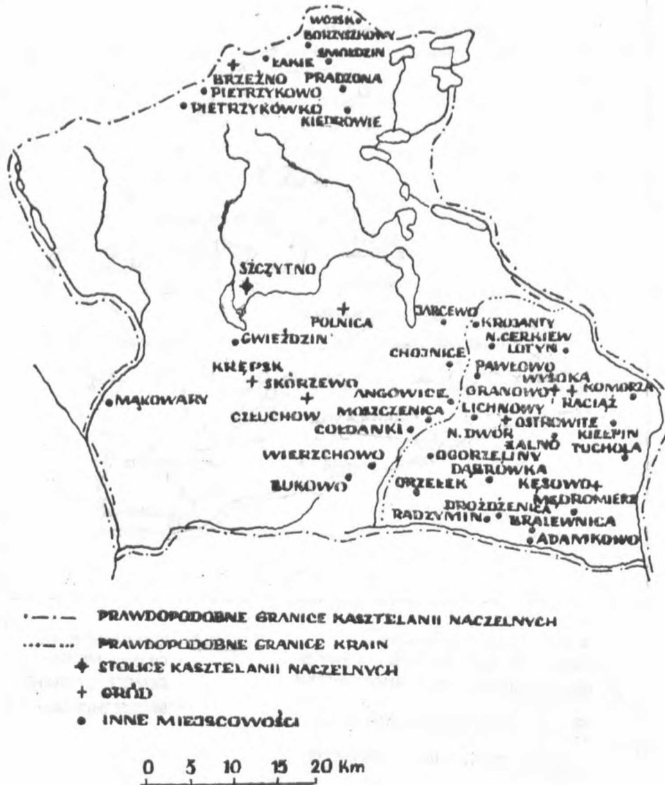
Rys. 3. Granice kasztelanii raciborskiej i szczyckińskiej (wg Śląski, op. cit. )

natomiast pozostałe odtworzono na podstawie podziałów kościelnych z XVI w.