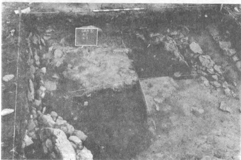
Fot. 2. Graña, Odcinek V - palenisko podczas eksploracji

Odcinek 5 eksplorowany był przez grupę archeologów z Katedry Archeologii Uniwersytetu Łódzkiego. Prace prowadzono warstwami mechanicznymi w ramach warstw naturalnych, stosując dokładną lokalizację (trójwymiarową) odkrywanych zabytków oraz charakterystycznych ułamków ceramiki. Całość materiału zabytkowego była zbierana w ramach czterech działek, na które podzielono odcinek. Eksplorację rozpoczęto od zerwania darni, pod którą na powierzchni całego wykopu występowała warstwa próchnicy przemieszana z węglami drzewnymi i popiołem, pochodzących z nowożytnych pożarów lub wypalenisk. W narożniku południowo-zachodnim na głębokości około 20 cm od powierzchni ukazał się rumosz kamienny. Znalaziono również fragmenty kamienia żarnowego. Po odsłonięciu całej powierzchni rumosz koncentrował się wyraźnie w zachodniej i południowo-wschodniej części odcinka. W centrum ilość kamieni wyraźnie była mniejsza. Występowała tam jasnobrunatna glina z osadzonymi w niej kilkoma bryłami przepalonej polepy i fragmentami ceramiki. We wschodniej części wykopu, niemal równoległe do profilu wschodniego, odsłonięto mur zbudowany bez użycia zaprawy z dobieranych kamieni. Równoległe do muru występował