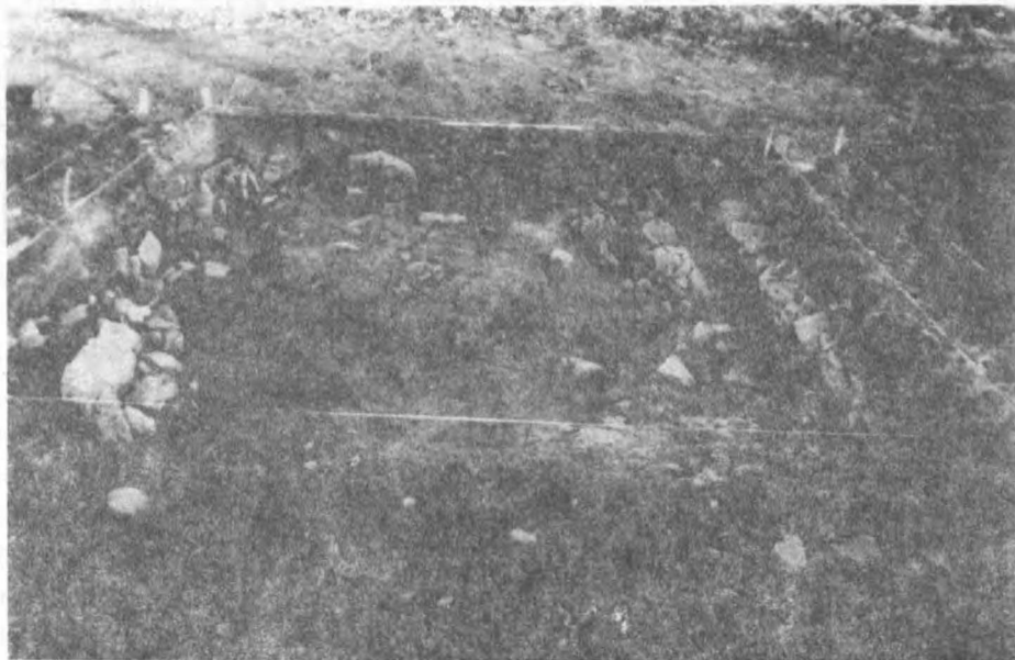
Fot. 1. Graña. Widok ogólny odcinka V

Wykopy wytyczono w jednym ciągu tak, aby uzyskać wstępne informacje o wszystkich podstawowych częściach osiedla. Usytuowano je w zachodniej części wzgórza, czyli w północno-zachodniej partii plateau , z zamiarem jego przecięcia wraz z obniżeniem wjazdowym. Cały ciąg wykopów podzielono na działki 4 x 4 m (w sumie 15 działek), z czego zbadano pięć na zachodnim krańcu wytyczonego ciągu. Po odkryciu fragmentów zewnętrznego muru obronnego, formowanego bez użycia zaprawy z nieregularnych kamieni z miejscowych złoży, wytyczono trzy następne odcinki w sąsiedztwie odcinka 4 i 2.