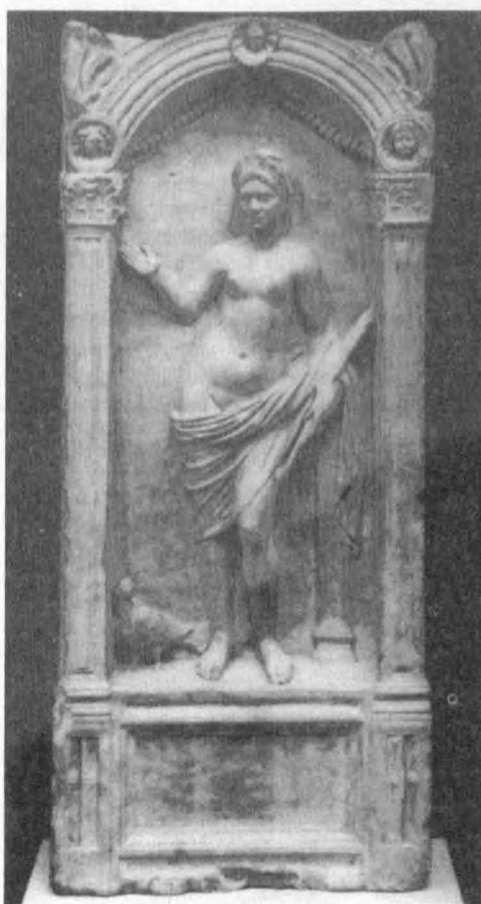
Rys. 5. Stela grobowca z wizerunkiem młodej kobiety. British Museum nr inw. 4-23.1

Podobna interpretacja jest możliwa w przypadku dekoracji malarskiej alkowy grobowca Q1 w Abila, która przybrałaby wtedy charakter prywatnego sanktuarium. Zaznaczyć należy, że bogactwo wystroju alkowy kontrastuje z ubóstwem reszty grobowca, mieści ona wiele pochówków, spośród których nie wyróżnia się pochówek dziewczyny przedstawionej malarsko. Barbet proponuje późną datę dekoracji malarskiej alkowy 46 . Długi okres używania grobowca bez wątplenia utrudnia kwestie interpretacyjne. Analiza dekoracji malarskiej nie wyklucza jednak datowania tego zabytku na II w. n.e., która to data jest przeze mnie proponowana. Brutalność stylu jest wynikiem prowincjonalizmu, nie zamierzonym produktem wyobraźni twórczej.