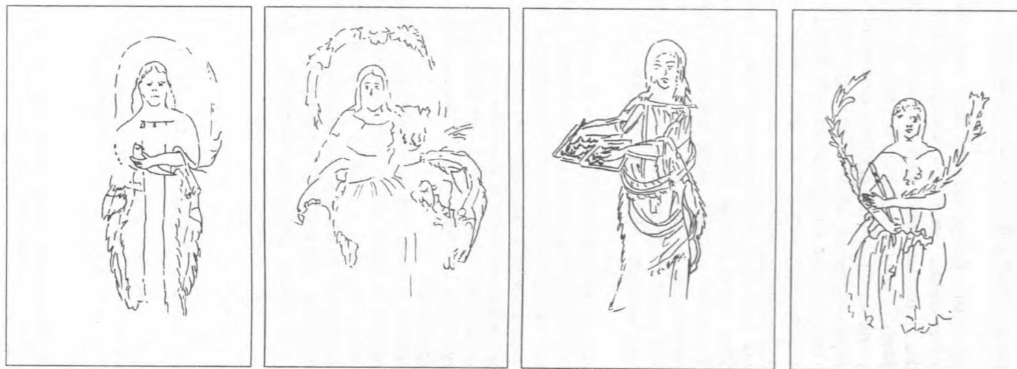
Rys. 2. Przedstawienia kobiece z dekoracji paneli ściennych grobowca Q1, Abila. Rysunek R. Wasiaka