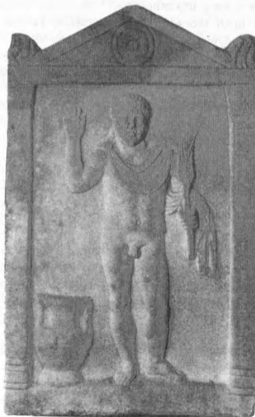
Rys. 4. Atleta trzymający palmę zwycięstwa. Stela ze zbiorów Muzeum Archeologicznego w Caesarea Maritima

Wyobrażenia zmarłej w różnych funkcjach życiowych znane są z terenów Rzymu z okresu Hadriana. Przykładowo tu omawiany monument składał się z czterech reliefów, z których dwa, dziś zaginione, znane są tylko z rysunków. Jeden, w postaci steli zachował się w zbiorach British Museum 45 (rys. 5). Na steli nieznana kobieta jest przedstawiona z palmą w ręku, analogicznie do dziewczyny z alkowy grobowca Loukianos, i z gołębiami u stóp jako Zwycięska Wenus. Drugą stela, jak można wnioskować z rysunku, przedstawiała kobietę jako kapłankę, trzecia, przedstawienie z figurami Trzech Gracji, miała ilustrować jej wdzięk, czwarty zaś wizerunek, dziś wmurowany w jedną ze ścian w posiadłości Richmond, Surrey, przedstawiał ją w stanie apoteozy, wznoszoną przez dwa Amorki.