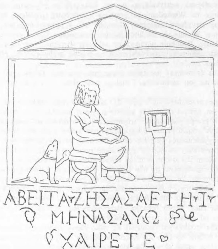
Rys. 3. Przedstawienia dziewczynki na steli grobowej w zbiorach British Museum, inw. nr 645. Rysunek R. Wasiaka

Wzrok nieznaney dziewczyny z Abila nie spoczywa na książce, lecz takie przedstawienie wydaje się być rezultatem konwencji artystycznej narzucającej frontalność. Ma ona sięgające do ramion rozpuszczone włosy. Rozpuszczone włosy wiąże się z żałobą, śmiercią i z pochówkiem, lecz rozpuszczone włosy ma także Avita, a z terenów Syrii dziewczynki przedstawiane na nagrobkach, jak np. Bersis córka Markellosa, której nagrobek znaleziony został w syryjskiej Harah 35 , miejscowości niezbyt odległej od Abili.