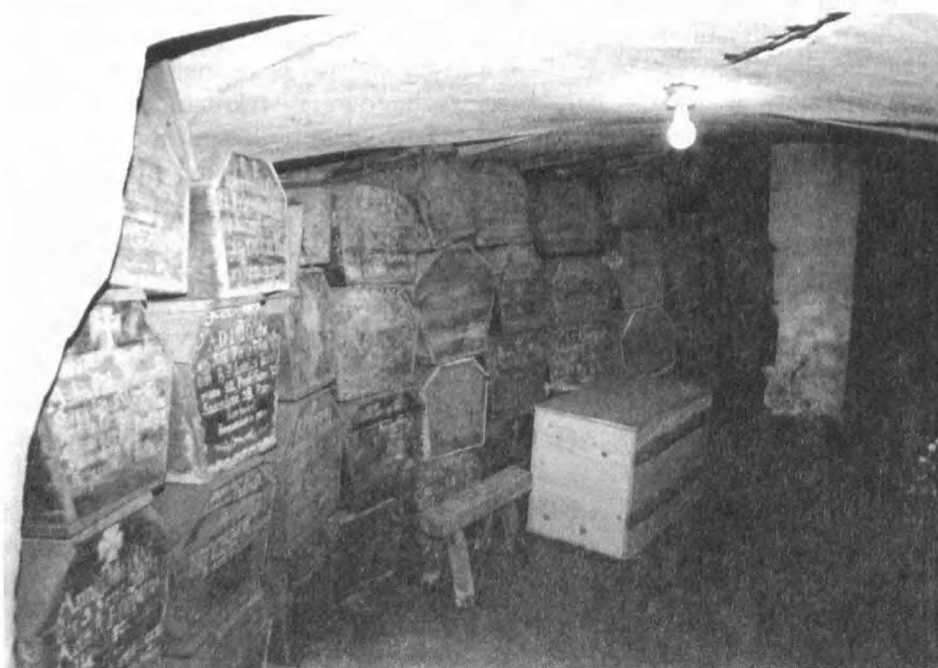
Fot. 3. Jemielnica, pochówki cystersów w krypcie pod kaplicą św. Józefa

Odkryto także 11 ułamków ceramiki pradziejowej kultury łużyckiej.