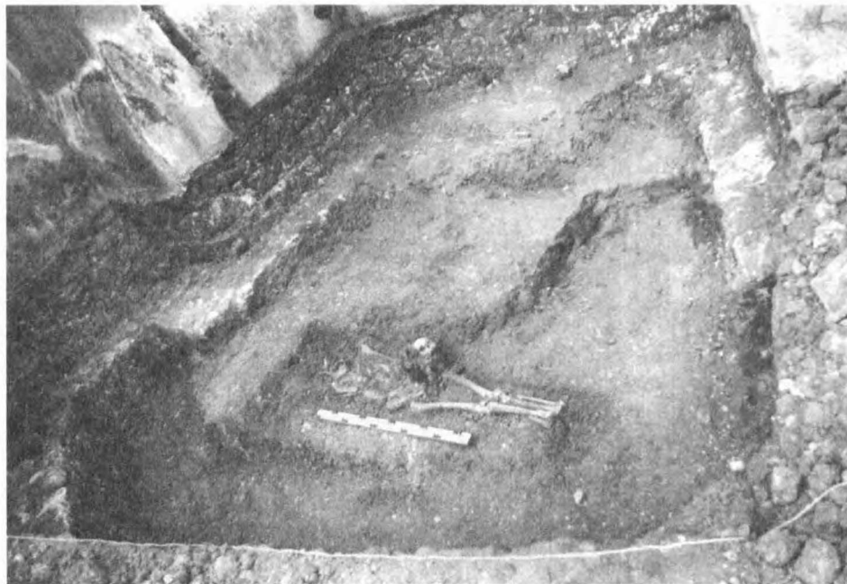
Fot. 2. Jemielnica, wykop II, fundamenty części gotyckiej kościoła i cmentarzysko

Wykop II zlokalizowano po południowej stronie kościoła w narożniku utworzonym przez ścianę prezbiterium i przylegającą doń kaplicę pomieszczoną na zamknięciu nawy bocznej. Stwierdzono, że gotycka kaplica została dostawiona do starszego od niej muru przypory ściany południowej prezbiterium. Wszystkie obserwowane w wykopie fundamenty wykonano z kamienia wapiennego, formowanego zgrubnie w bloki i starannie układanego w warstwy, wiązane zaprawą wapienną. Obserwowane mury posadowione zostały bezpośrednio na stropie skały wapiennej.