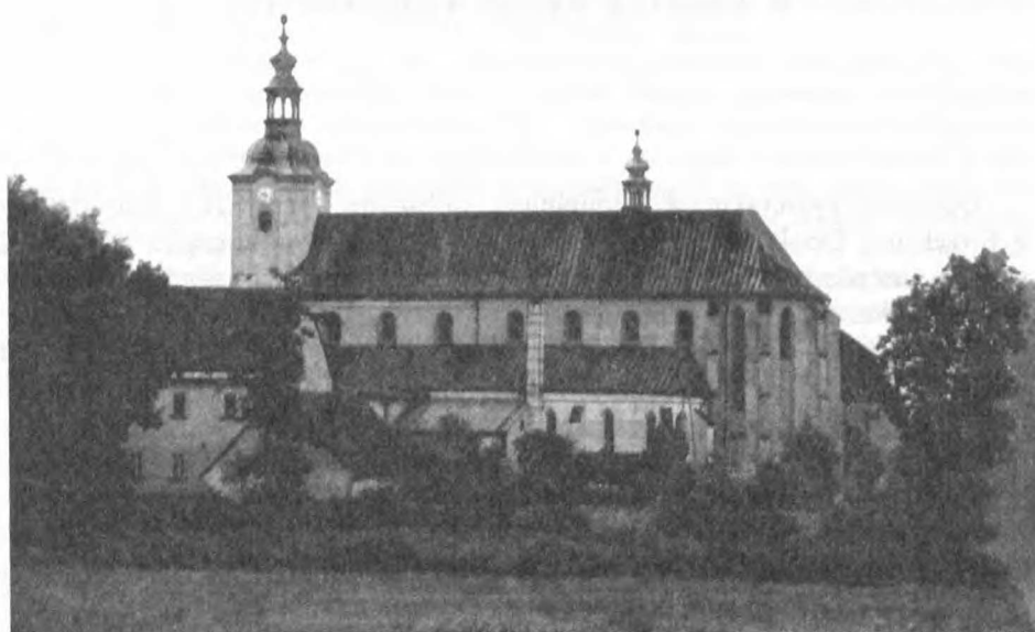
Fot. 1. Jemielnica, zespół pocysterski

Położony w centrum wsi zespół pocysterski składa się obecnie z kościoła, którego wyniosła, zwieńczona barokowym hełmem wieża widoczna jest z odległości kilku kilometrów, pozostałości cysterskiego, trójskrzydłowego klastrum oraz budynków stanowiących pierwotnie zabudowania opactwa. Obiekt użytkowany jest przez miejscową parafię rzymskokatolicką.