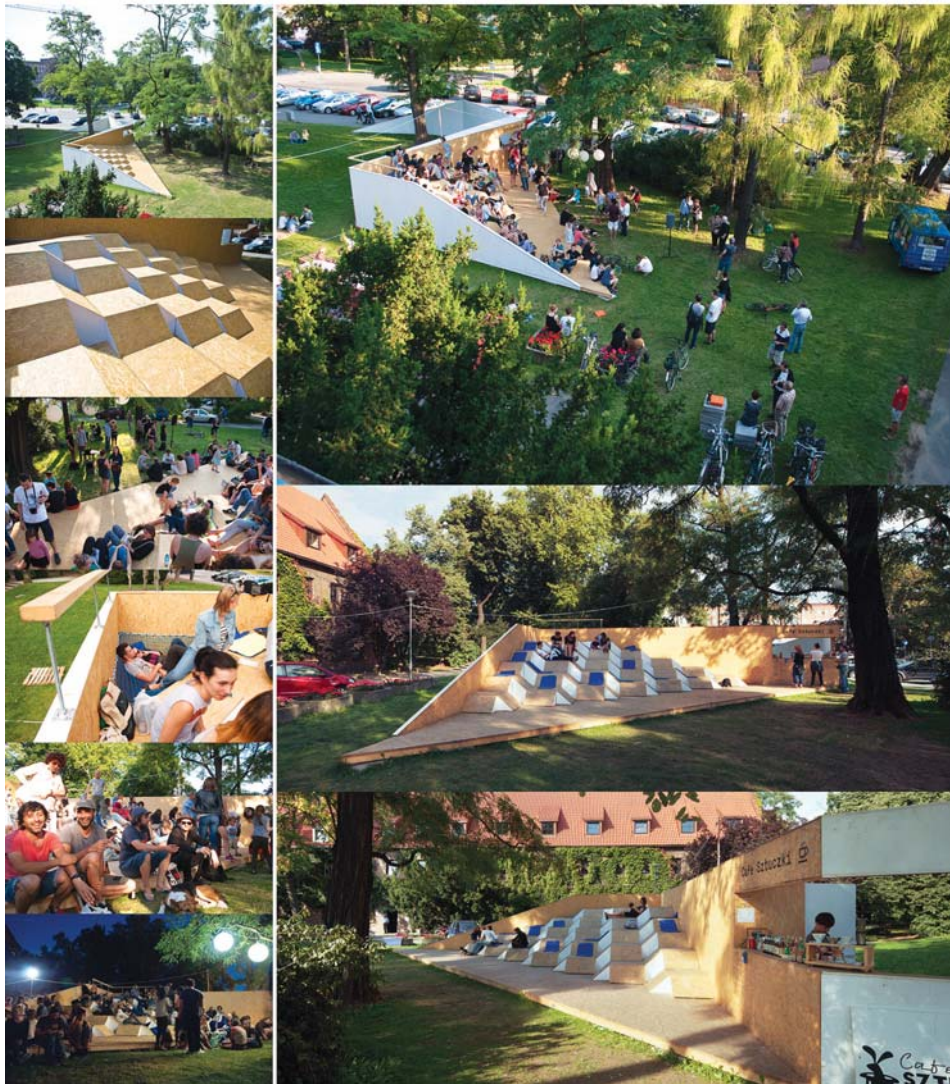
Il. 1. „Polegiwacz”/„Lounge-About”, arch. Sofft – Mikołaj Smoleński.