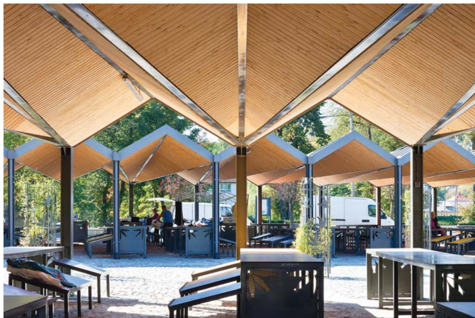
Il. 2. Plac Targowy w Mszanie, arch. eM4. Pracownia Architektury Brataniec.

Plac zlokalizowany nad rzeką Mszanką, dopływem Raby, powstał w ramach projektu Ministerstwa Rolnictwa „Mój Rynek”. Precyzyjne wytyczne gminy oparte były o plan jej rewitalizacji, opracowany także przez biuro eM4. Zakładały one użycie w architekturze ugruntowanych historycznie, tradycyjnych elementów regionalnych – motywu parzenic, a także wykorzystanie miejscowej kostki brukowej. Nawierzchnię urozmaicono płytami piaskowca oraz wprowadzono liczne, indywidualnie projektowane elementy małej architektury z użyciem drewna i metalu. Jednak najbardziej definiują architekturę udane przekrycia szeregów straganów. Wprowadzono zintegrowane dachy w formie stalowych tarzownic podbitych drewnem, których trójkątna geometria nawiązuje do tradycji architektury regionalnej, lecz jej nie imituje. Sztuka rozwiązania placu dobrze służy społeczności Mszany i górskiej okolicy, w powszechnej opinii stanowiąc wręcz powód do dumy – z powodu estetyki i użyteczności przyjętych rozwiązań.