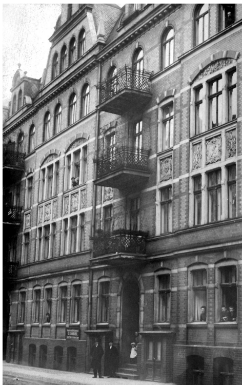
Ryc. 1. Kamienica, w której mieszkał Janusz Zeyland przy ul. św. Piotra, obecnie Krysiewicza (zbiory Katedry i Zakładu Historii i Filozofii Nauk Medycznych Uniwersytetu Medycznego w Poznaniu)

Prac Historycznych Akademii Medycznej im. Karola Marcinkowskiego w Poznaniu 6 , jednak dotychczas nie dostrzeżono, że prostują niektóre błędy biografów Zeylanda, np. że został ciężko ranny podczas wojny polsko-bolszewickiej, albo że został odkomenderowany na studia lekarskie na Uniwersytecie Warszawskim 7 .