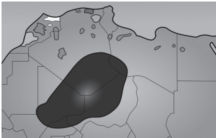
Mapa 1 Obszar zamieszkały przez Tuaregów, na którym używany jest język tuareski