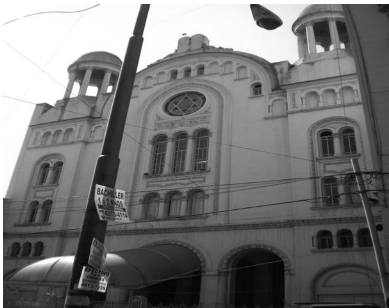
Fotografia 4. Synagoga reformowana w dzielnicy Once w Buenos Aires