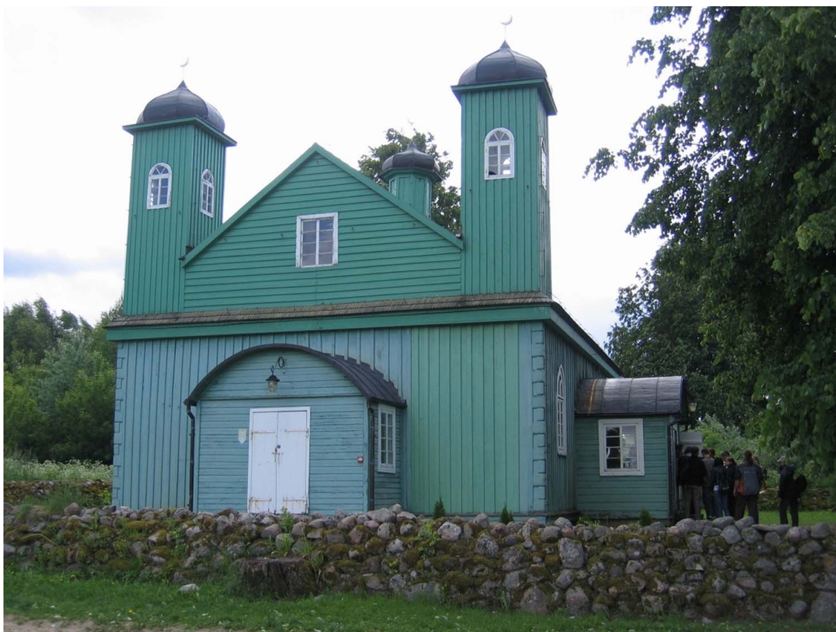
Fot. 5 – Meczeta w Kruszynianach na Szlaku Tatarskim