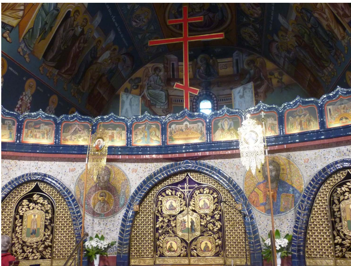
Fot. 6 – Wnętrze cerkwi w Hajnówce

Wśród wielu cerkwi charakterystycznych dla obszaru Puszczy Białowieskiej terenów sąsiednich szczególnie dwie są warte uwagi. Pierwsza z nich to murowana cerkiew św. Mikołaja w Białowieży, wybudowana w czasach carskich. O jej unikatowości świadczy znajdujący się w środku ikonostas z chińskiej porcelany, sprowadzony z Petersburga na specjalne życzenie cara Aleksandra II. Nie ma w Polsce drugiego takiego zabytku, a w Europie jeszcze tylko dwie cerkwie zostały podobnie wyposażone. Druga cerkiew, o zupełnie innym, bo współczesnym charakterze to cerkiew (sobór) św. Trójcy w Hajnówce, ukończona w 1981 roku. Przyciąga ona turystów swoim modernistycznym kształtem, jak i pięknem wykończenia. Ponadto w kilka majowych dni dodatkowym atutem zachęcającym do odwiedzenia Hajnówki jest odbywający się to co rok Międzynarodowy Festiwal Muzyki Cerkiewnej. Z roku na rok (od pierwszych Dni Muzyki Cerkiewnej zorganizowanych w maju 1982 roku) przyjeżdża tu coraz więcej zespołów z różnych stron świata. Te kilka dni w roku to niezwykła uczta duchowa i muzyczna, utrwalana w formie wielu płyt i nagrań, a oparta na najpiękniejszym i jedynym instrumencie używanym w cerkwi prawosławnej – ludzkim głosie 8 .