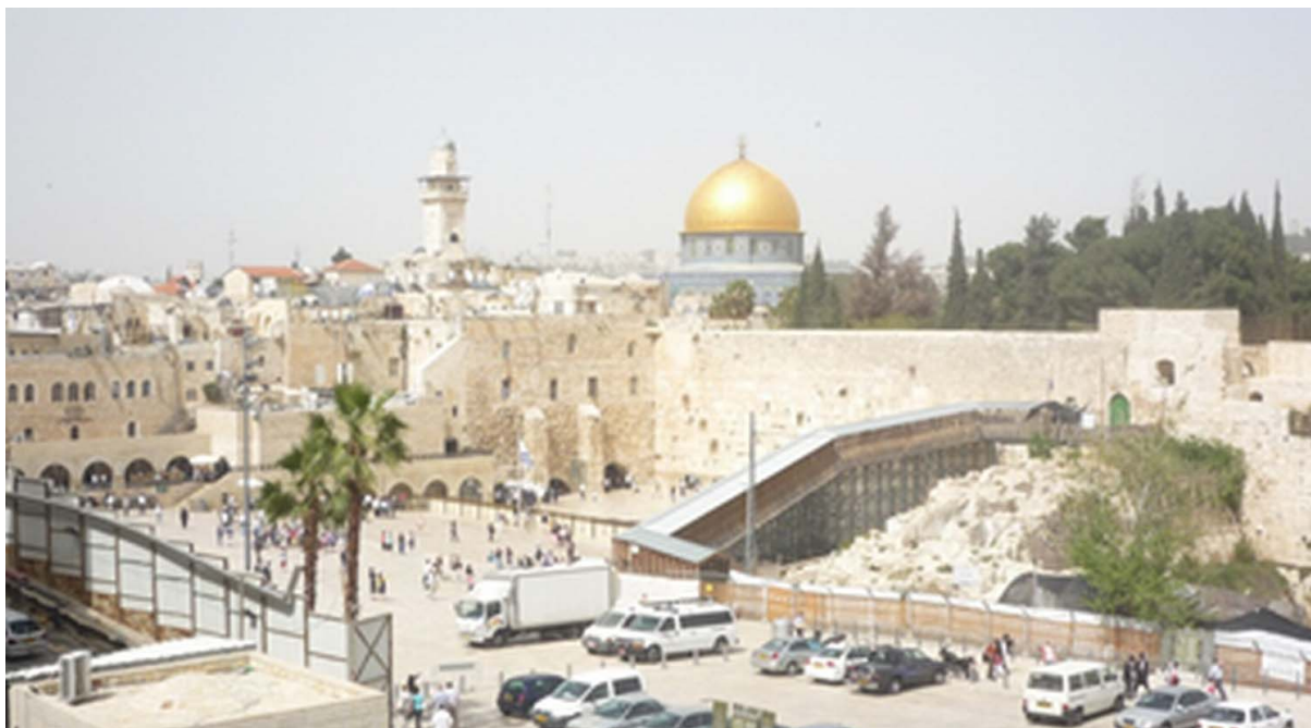
Fot. 1. Ściana Płacz (Zachodni Mur) – jedyny zachowany fragment dawnej Świątyni Jerozolimskiej

Ciekawymi słowami opisał stolicę Izraela na swoim blogu jeden z turystów [ http://www.tomontheroof.com/blog/jerozolima/ , 28.04.2013], który stwierdził, że „prawdziwa Jerozolima nie tylko skłania do refleksji, ale zaskakuje i szokuje. (...) hałas wybuchów dochodzący z pobliskiej strefy Gazy ledwie ucichł i nie wiadomo na jak długo...”. Taka jest Jerozolima, miasto, które niezależnie od upływu lat może ciekawić i inspirować, ale i być powodem strachu, miasto, które na starych mapach pojawia się jako centrum świata, a wciąż adorowane jest jak młoda narzeczona [ http://www.goisrael.pl , 1.05.2013].