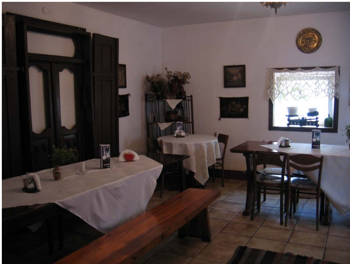
Fot. 7 – Restauracja „Tejsza” w Tykocinie

Warto jednak wspomnieć, że obecnie w podziemiach dawnego Domu Talmudycznego mieści się restauracja „Tejsza”, serwująca potrawy kuchni żydowskiej. Nazwa restauracji jest nieprzypadkowa, ponieważ w języku jidysz oznacza kozę, która dla podlaskich Żydów była symbolem dostatku. W menu „Tejszy” wyróżniają się dania żydowskie, m.in. cymes, kugel, kreplach itp. Mimo nie w pełni widocznego wejścia, restauracja cieszy się dużym zainteresowaniem przyjezdnych, zarówno z Polski jak i ze świata.