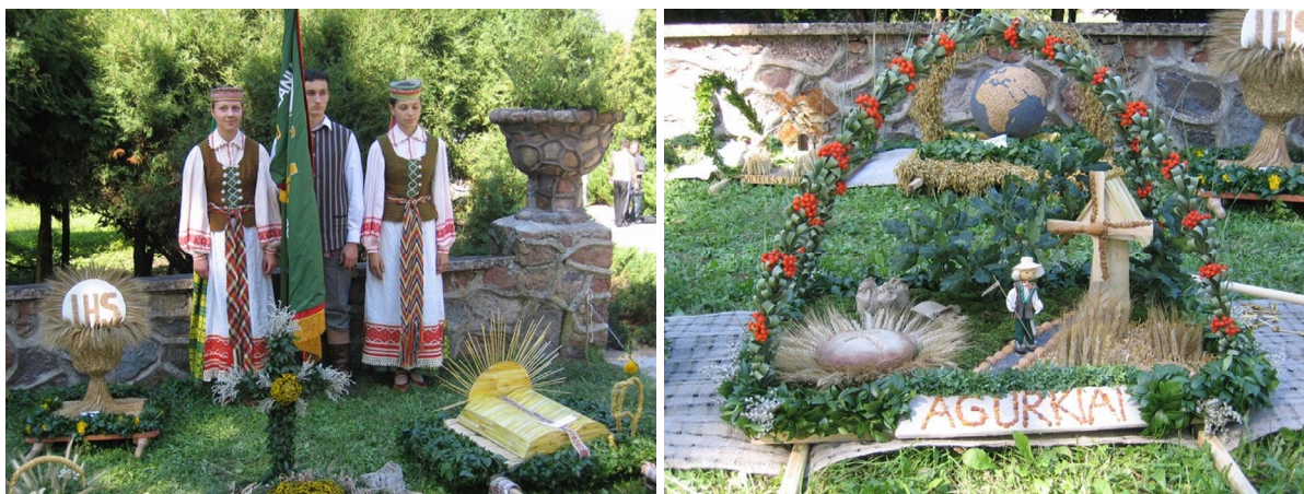
Fot. 2 i Fot. 3 - Święto Chleba, Mleka i Miodu w Puńsku

Obecnie Ziemia Sejneńska jest często nazywana Małą Litwą, jako że mniejszość litewska 6 stanowi tu znaczny odsetek (np. w gminie Puńsk Litwini stanowią 80% mieszkańców), a Puńsk (lit. Punkskas) – „litewską stolicą Polski”. Zresztą Puńsk jest miejscowością, w której na ulicy częściej słyszy się język litewski niż polski. Turyści szczególnie chętnie przyjeżdżają do Puńska 15 sierpnia – jest to kościelne święto Matki Boskiej Zielnej połączone tu ze Świętem Chleba, Mleka i Miodu. Ludzie – często w strojach ludowych – idą do kościoła z kwiatami, ziołami i kłosami zbóż, a po mszy odprawianej w języku litewskim, rozpoczyna się jarmark, podczas którego przyjezdni mogą kupić lokalne wyroby spożywcze (chleb, ciasta, w tym przede wszystkim sękacz, sery, miody, wędliny), a także wyroby z drewna i gliny, koszyki, haftowane serwety itp.