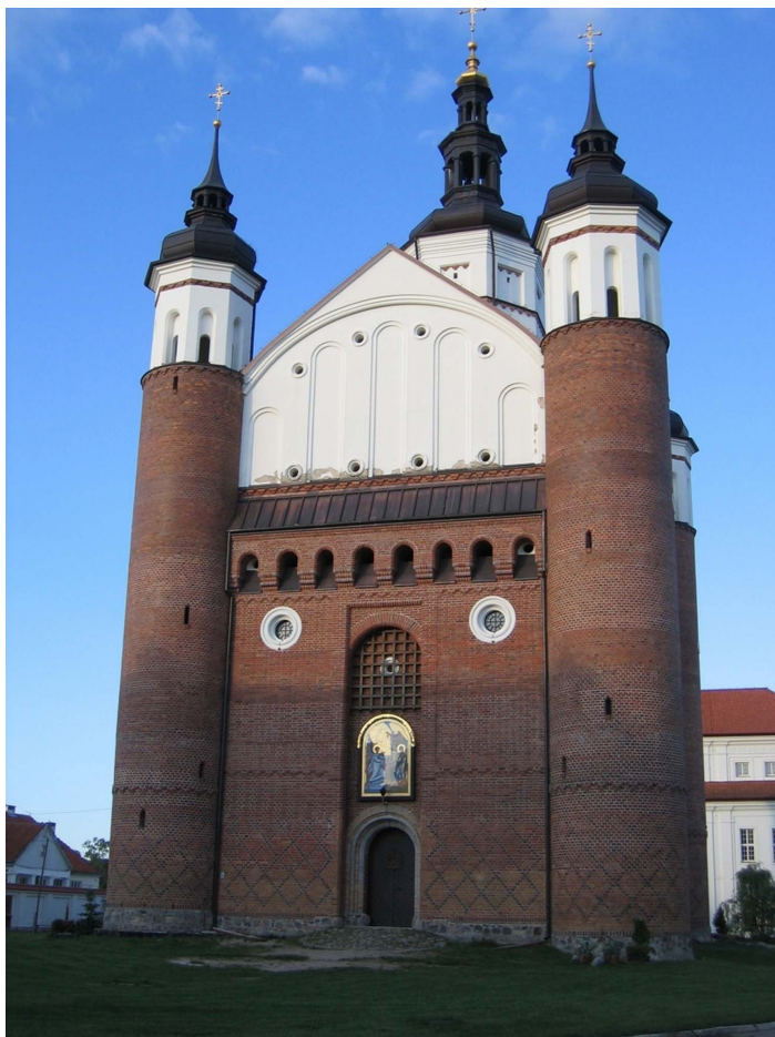
Fot. 4 - Cerkiew pw. Zwiastowania NMP – przykład połączenia architektury wschodu i zachodu

Źródło: fot. Małgorzata Durydiwka (maj 2009)