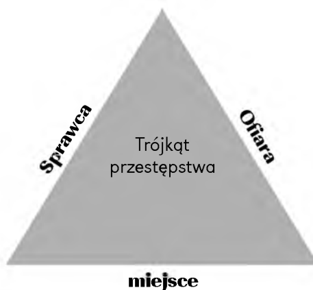
Rysunek 1. Trójkąt kryminalny