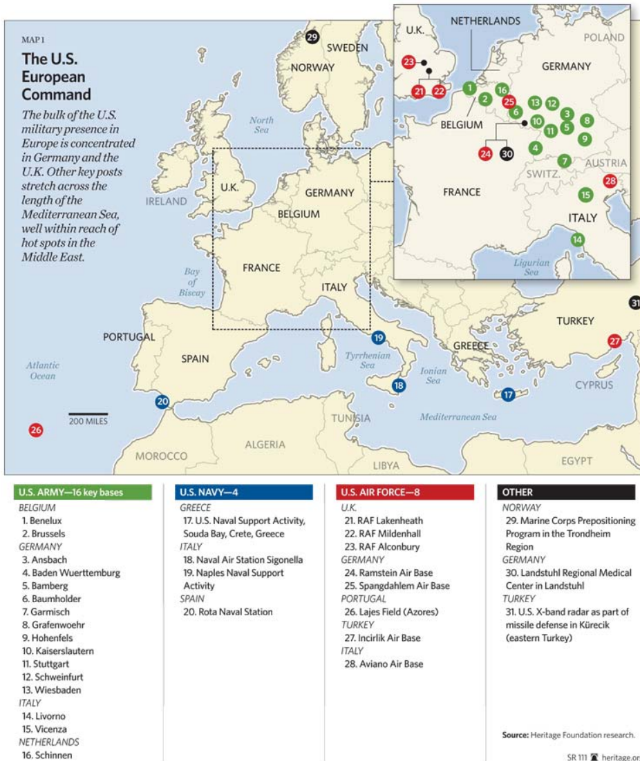
Rysunek 1. Amerykańskie bazy w Europie w 2012 r.