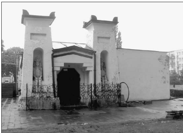
Końskie, Oranżeria Egipska. Pylon od strony wschodniej. Fot. J. Śliwa, 2006

czonymi powyżej 23 . Pomiedzy opisanyimi wieżami-pylonami od strony wschodniej usytuowano rodzaj klasycystycznego portyku z trójkątnym przyczółkiem (portyk ten osłaniał dodatkowo, boczne wejście do oranżerii).