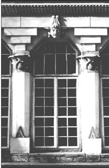
Końskie, Oranżeria Egipska. Egipsyzujące półkolumny i belkowanie galerii południowej. Fot. J. Śliwa, 2006

wyżej – odwrócona piramida schodkowa, złożona z trzech elementów. Na takiej konstrukcji wspierają się belki architrawu (łączenia bloków wypadają dokładnie na osiach kolumn) zwieńczone gzymsem cavetto ze stylizowanymi ureuszami 29 . Półkolumny południowej galerii łączone są rodzajem arkadowych pseudo-łuków (z ostrymi załamaniem), a w miejscu zworników umieszczono oryginalnie ukształtowane maski, wywodzące się ze specyficznej formy egipskich kapiteli hatoryckich 30 .