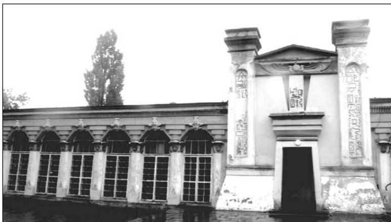
Końskie, Oranżeria Egipska. Wejście główne w elewacji południowej oraz fragment kolumnady. Fot. J. Śliwa, 2006

umieszczono charakterystyczne torusy oraz gzymсы cavetto , natomiast ich zamknięcie od góry stanowią niskie namiotowe nakrycia. Na frontowych powierzchniach obu wież, w łukowato zwieńczonych wgłębieniach, umieszczono szereg pseudohieroglificznych znaków, bardzo odległych od swych starożytnych pierwowzorów. Właściwe wejście do oranżerii, prostokątne, lekko zwężające się ku górze, usytuowane jest pomiędzy wspomnianymi ryzalitami. Jego obramowanie zwieńczone jest mocno ku górze rozbudowanym gzymsem złożonym z torusów i cavetta . Pionowy „blok” (pokryty pseudohieroglifami) umieszczony na osi symetrii otworu wejściowego, ponad gzymsem, stanowi łącznik z przyczółkiem ozdobionym uskrzydłonym dyskiem słonecznym.