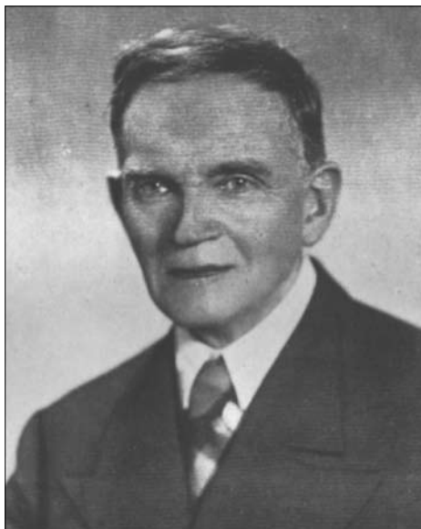
Adresatka i autor listów.