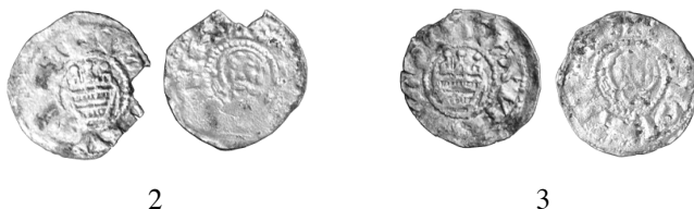
Ryc. 2–3. Święte. Denary pomorskie

I. M.: stanowisko 8, AZP 33–10/97, hektar XXVI, ar 76, ćw. B–D. D.: 2008 r. Ok.: badania archeologiczne prowadzone przez mgr Wioletę Słotę i mgra Michała Dzioba z Pracowni Archeologiczno-Konserwatorskiej Alina Jaszewska w Zielonej Górze na zlecenie Generalnej Dyrekcji Dróg Krajowych i Autostrad, Oddziału w Szczecinie (badania archeologiczne przed budową obwodnicy Stargardu Szczecińskiego). Kontekst: wczesnośredniowieczny grób szkieletowy (obiekt 713), poniżej stóp. L.: dwie monety srebrne. Zb.: Muzeum Narodowe w Szczecinie (nr depozytu WKZ: MNS/D/136/378); połowy nr inw. 45/08.