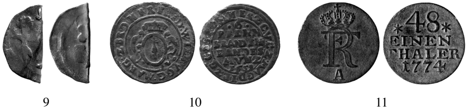
9 10 11