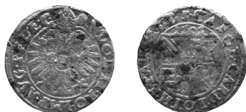
Ryc 7. Muniakowice, gm. Słomniki, 3 krajcary Karola Lotaryńskiego

Strasburg, biskupstwo, Karol Lotaryński (1592–1607), 3 krajcary 1602, Saurma-Jeltsch 1959/962, 1,78 g, 20,8 mm (ryc. 6).