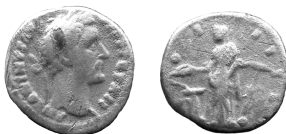
Ryc. 1. Jawor. Denar Antonina Piusa, skala 1:1

M.: teren ogródków działkowych „Hefajstos” w północnej części miasta. D.: lato lub jesień 2009 r. Ok.: prace ogrodnicze. L.: 1 moneta.