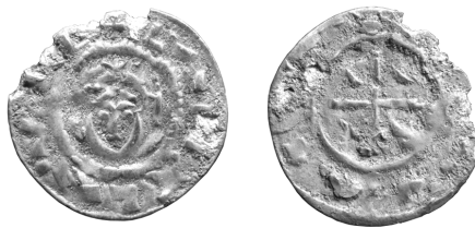
Ryc. 5. Siewierz. Denar węgierski Władysława I.

Polska , zabór rosyjski, Mikołaj I, 1 złoty polski 1832, 4,127 g, Kop. Skor. 2685. Rosja , Aleksander II (1855–1881), 1 kopiejka 1856, Warszawa, 4,607 g, Kop. Skor. 9507; r. ?, Warszawa, 4,495 g. Rosja , Aleksander III (1881–1894), 2 kopiejki 1889, 6,107 g, Semenov 202. Rosja , Mikołaj II (1894–1917), ½ kopiejki 1898, 1,44 g, Semenov 231/54. Rosja , Mikołaj II, 1 kopiejka 1894, 3,163 g, Semenov 218; 1907, 1,137 g, Semenov 218. Rosja , Mikołaj II, 5 kopiejek 1902, 0,821 g, Semenov 185. Śląsk , Leopold I (1657–1705), greszel 1686, Opole, 0,419 g, 15 mm, Fried. Seger 674 4 . Węgry , Władysław I (1077–1095), denar, 0,315 g, 14 mm, Huszár 24 5 . Av.: LADISLAVS REX, głowa króla w koronie na wprost. Rv.: legenda nieczytelna, krzyż z klinami w kątach. Poza tym 20 monet z XX w. Norymberga , Wolf Lauffer II (działal 1612–1651), liczman Róża/glob , Mitchiner 1707–1719 6 .