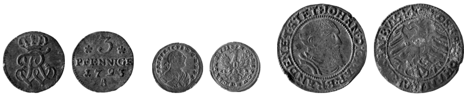
12 13 14