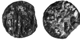
Ryc. 4. Święte. Agrypinka połabska

3. Saksonia , denar anonimowy, tzw. agrypinka połabska, men. Bardowik, prawdopodobnie początek XII w. (ryc. 4).