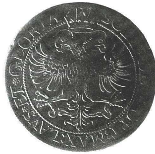
7. Ort pruski Jerzego Wilhelma, 1623; 8. Póltalar czeski Rudolfa II, 1611; 9. Floren srebrny m. Zwolle Macieja II, b.d.; 10. Talar szwajcarski m. St. Gallen, 1621.