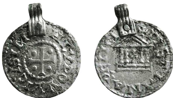
Ryc. 1. Janów Pomorski, denar Ludwika Pobożnego. Skala 1,5:1.

Cesarstwo Karolińskie , Ludwik Pobożny (814–840), mennica nieokreślona, denar z lat 822–840. Av.: w polu krzyż równoramienny z rozszerzonymi końcami, z punktami między ramionami, obwódki perełkowe, w otoku [+]HLVDOVVICVSIMP; Prou 6 1009; Morrison, Grunthal 7 472; MEC 1 8 , 800. Rv.: w polu kaplica z krzyżem między 4 kolumnami z zaznaczonymi kapitelami, w otoku +PISTIANARELIGI[O]; Prou 1002/9 (lecz poprzeczki w A), Morrison, Grunthal 472, MEC 1, 802 (lecz inne kolumny). Do monety zostało przynitowane srebrne uszko o wymiarach 3,4 na 17 mm. Waga 1,5 g, średnica 23–29 mm. Monetę znaleziono na obszarze polderu nr 1, ar XXI/14 (Ryc. 2).