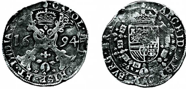
fol. 11. półpatagon Karola II, 1694 r., Del. -, G-H -; 13,874 g