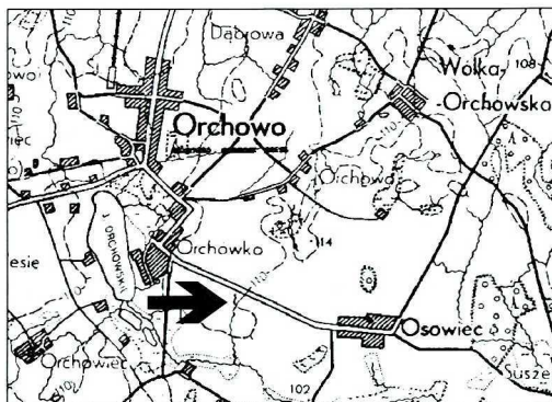
Rys. 1. Okolice ukrycia skarbu