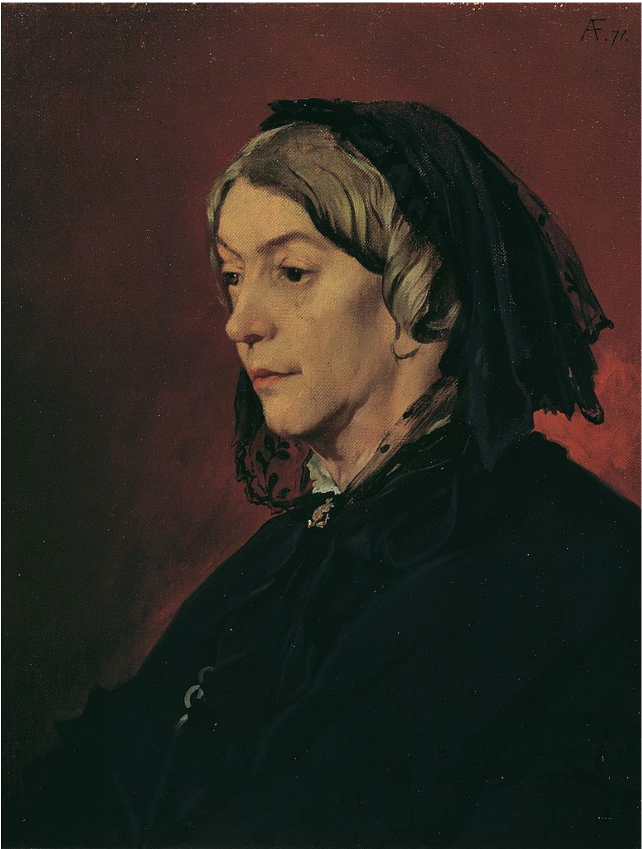
2. A. Feuerbach, Henriette Feuerbach, die Stiefmutter der Künstlers , 1871, olej na płótnie, 63cm x 50 cm, Belvedere Wiedeń.