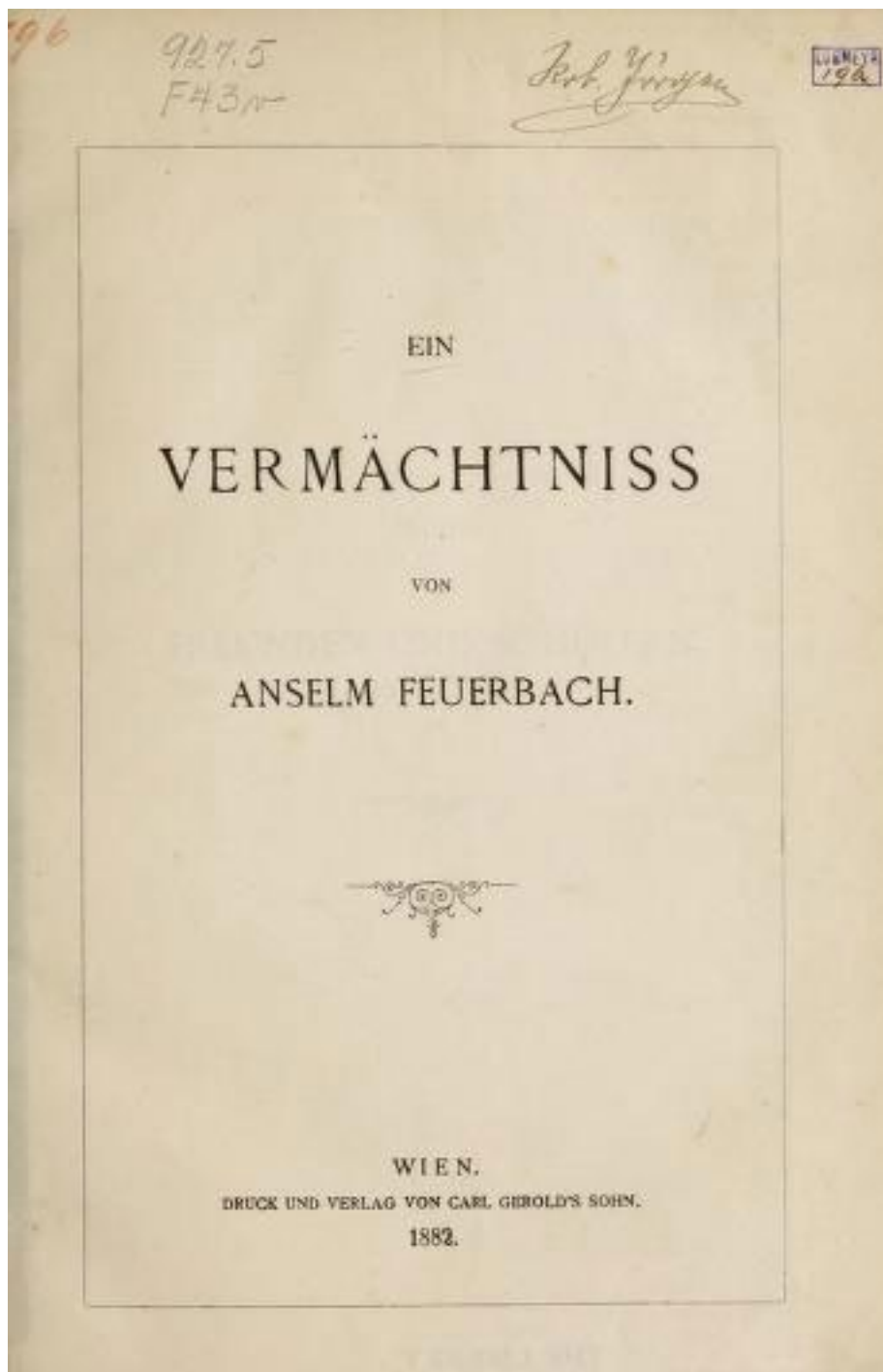
3. Ein Vermächtnis , strona tytułowa, Wien 1882, C. Gerold's Sohn, źródło: https://archive.org/details/einvermchtniss1882feue/page/n5/mode/2up