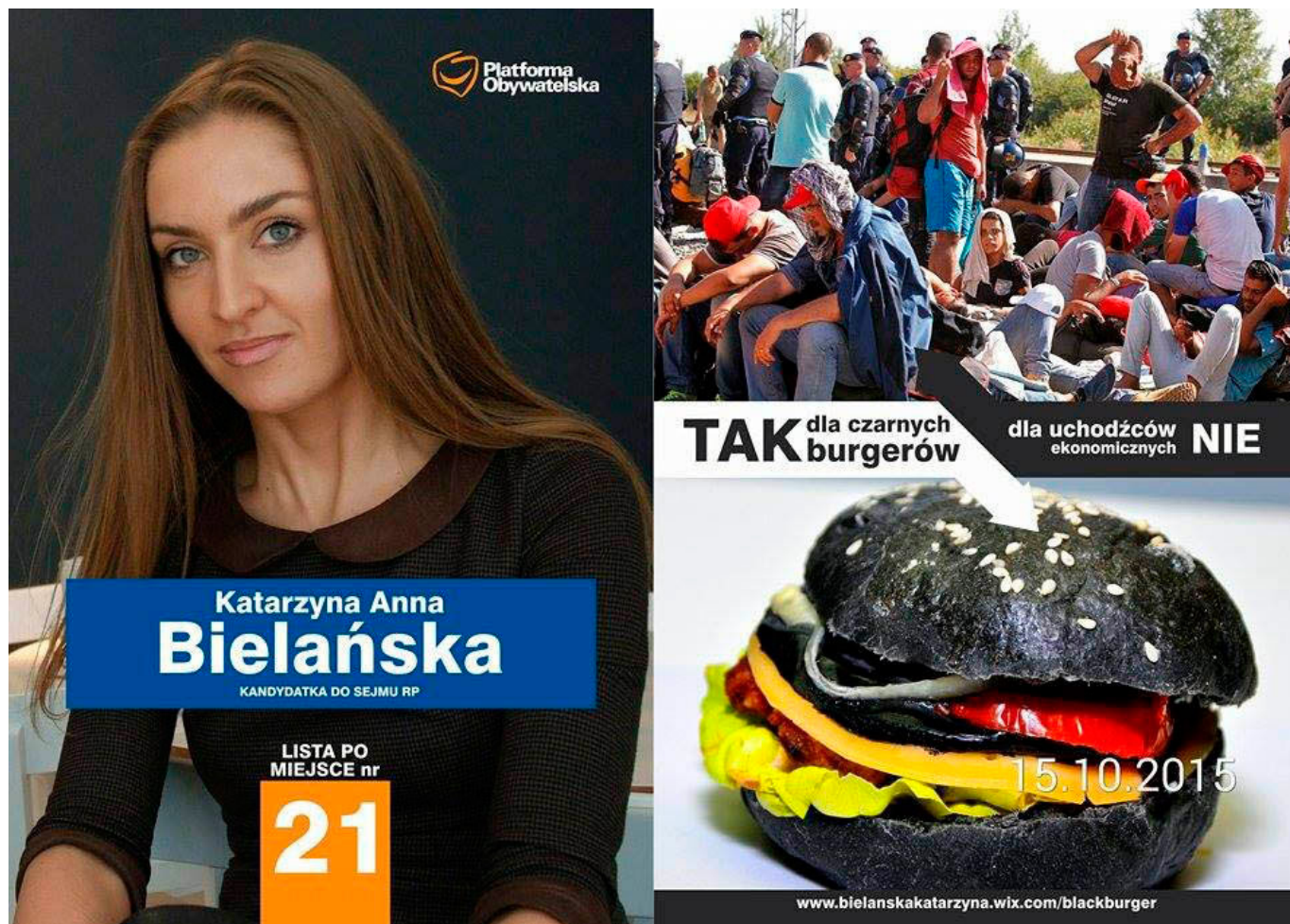
Grafika 2: Przykład wykluczenia obywatelskiego