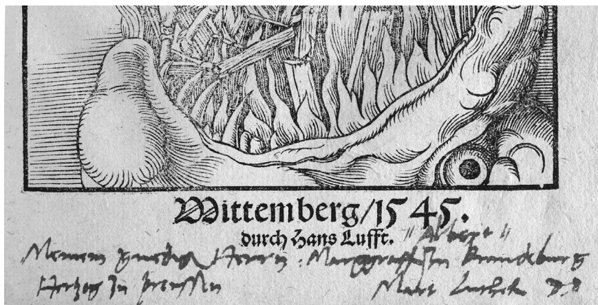
Il. 2. Fragment karty tytułowej toruńskiego egzemplarza dzieła Marcina Lutra Wider das Bapstum zu Rom vom Teuffel gestiftt ; Biblioteka Uniwersytecka w Toruniu, sygn. Ob.6.II.2382, z dedykacją Lutra dla Albrechta von Brandenburg-Ansbach

Formułę grzecznościową – „mojemu czcigodnemu panu” – odnajdujemy także w bogatej korespondencji Lutra z Albrechtem z lat 1523–1545 (Albrecht do Lutra wysłał 39 listów, a Luter do księcia 22 9 ). Przykładowo list z 9 czerwca 1542 r., jak wiele innych, rozpoczął Luter słowami: „Dem Durchleuchtigen, hochgebornen Fursten und Herrn, Herrn Albrecht, Marggraf zu Brandenburg, Hertzogen in Preussen, Stetin und Pommern etc., meinem gnedigen Herrn” 10 . Ostatni znany list Lutra do księcia wysłany został 2 maja 1545 r.