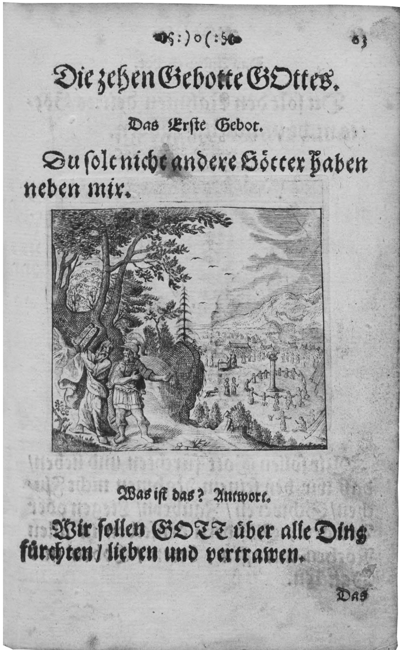
Il. 2. J. Löisentin, Christliche Hauszucht... , Dantzig: D. F. Rhete 1655, s. 63, BJ, sygn. Mus. ant. pract. L 1002, https://jbc.bj.uj.edu.pl/publication/292769/content (4 V 2018)