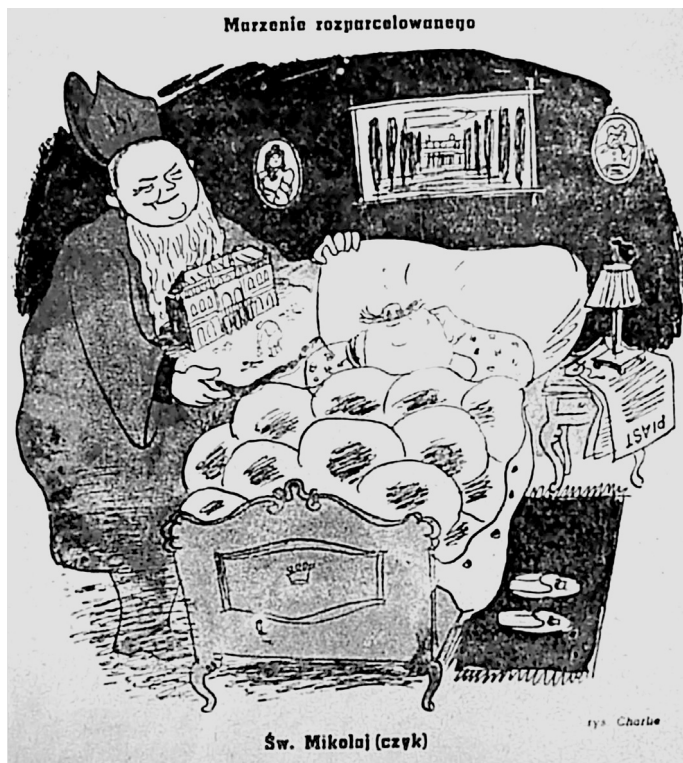
2. „Szpilki” 1945, nr 41.

Kompozycja ta miała skłaniać do konstatacji, że wicepremier nie reprezentował interesów chłopów, a wraz z usuniętymi z areny dziejów byłymi ziemianami, miał na celu przywrócenie dawnego ładu społeczno-ekonomicznego na wsi 39 .