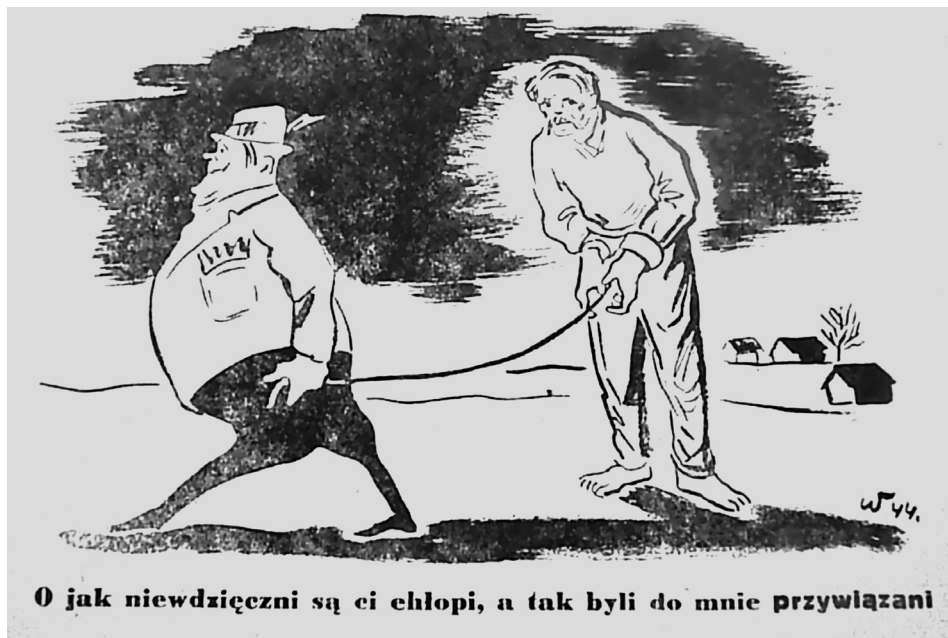
1. „Wieś” 1944, nr 3.

łamach „Wsi”, ilustrujący potencjalne efekty działań niezadowolonych ziemian wymierzonych w reformę rolną, przy użyciu w warstwie tekstowej dobrze znanego na wsi przysłowia o „porywaniu się z motyką na słońce”. Widać wyraźnie degradację i dehumanizację postaci poprzez animalizację. Kształt głowy, wyraz twarzy, szczególnie nos, mogły wywoływać skojarzenia z ptakami padlinożernymi. Autor rysunku zdecydowanie ograniczył pole interpretacji, określając dodatkowo stan emocjonalny postaci („obszarnicy niezadowoleni”) i umieszczając na tarczy słonecznej podpis „reforma rolna”. Wśród wielu znaczeń symbolicznych słońca znaleźć można takie, które w połączeniu z kontekstem historycznym mówią wiele o kodzie rysunku. Słońce symbolizuje z jednej strony początek, z drugiej nieskończoność, ale także triumf, mądrość, władzę, pokój 27 . W tym przypadku autor przedstawił wschód słońca jako początek, nadzieję na lepsze życie. Praca Piotrowskiego stanowiła ilustrację do artykułu Jana Szczepańskiego Reforma rolna w świadomości narodowej , w którym czytamy m.in. o „sabotażu