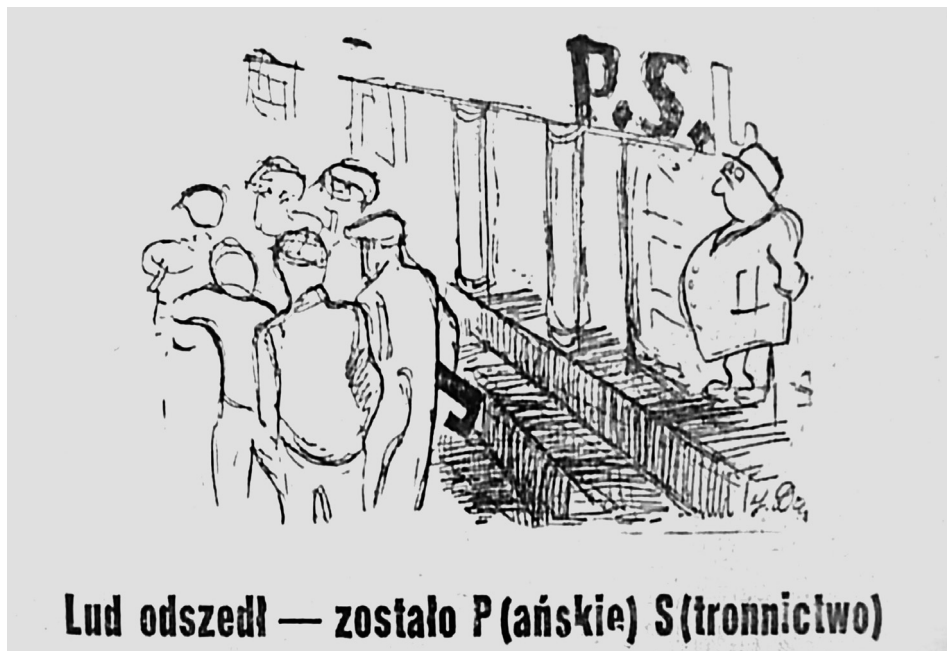
3. „Chłopska Droga” 1947, nr 16.

strony stosunek badanej grupy do zmian, a z drugiej brak możliwości wpływania na rzeczywistość.