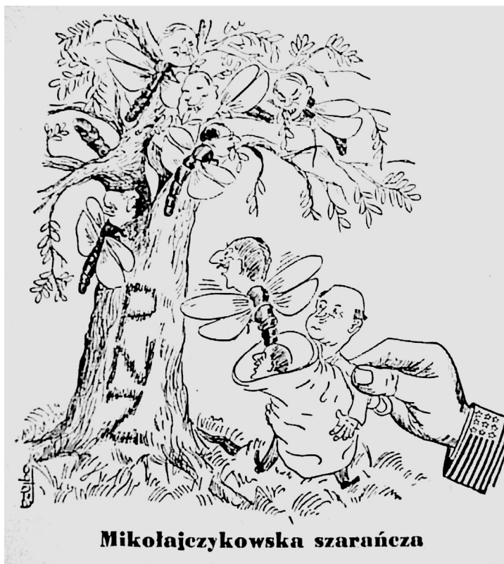
8. „Sztandar Ludu”, 28 I 1951.

Podobnego przesłania można dopatrywać się w kilku rysunkach stanowiących historyjkę obrazkową. Autorem tego dzieła, które ukazało się na łamach „Szpilek”, był Ferster, a nosiło ono tytuł „Proces byłych obszarników sabotażystów z PNZ”. Na sześciu kolejnych rysunkach przedstawiono główne zarzuty: współpracę z podziemiem, celowe obniżanie plonów, nieracjonalną uprawę i hodowlę, negatywny stosunek do mechanizacji rolnictwa i wreszcie próbę stworzenia świeckiego zakonu byłych ziemian 96 .