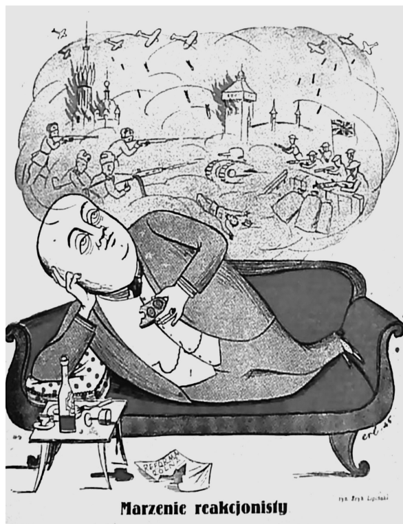
7. „Szpilki” 1945, nr 12.

spełniają kontynuatorzy tych tradycji. W 1948 r. „Mucha” opublikowała historyjkę obrazkową zatytułowaną Dzieje rodu Opoj-Nierobskich w portretach . Już samo sztucznie stworzone nazwisko niesie znaczny ładunek negatywnych emocji. Bardzo sugestywny był również dobór staropolskich urzędów kojarzących się z dbałością o rozkosze podniebienia, wygody i zasobność kieszeni. Głównego bohatera, „podsądnego waluciarza (r. 1948)”, w sztafecie pokoleń poprzedzili: „po/d/kątny doradca (r. 1898)”, „podskarbi (r. 1843)”, „podkomorzy (r. 1798)”, „podstoli (r. 1748)” i „podczaszy (r. 1698)” 80 . W podobnym tonie zaprezentował środowisko Jerzy Srokowski, publikując w marcu 1948 r. historyjkę obrazkową piętnującą jego wady: zepsucie moralne, wygodnictwo, lenistwo, brak honoru, awanturnictwo, nieprzystosowanie do zmieniających się warunków. Wady te zostały ukazane z różnych perspektyw czasowych: roku 1898 i 1948. Szczególnie wymowne są obrazy związane z 1948 r.: arystokratka czekająca na tramwaj, której lokaj obwieszcza: „Pani hrabino czwórka zajęła”, czy lokaj pytający