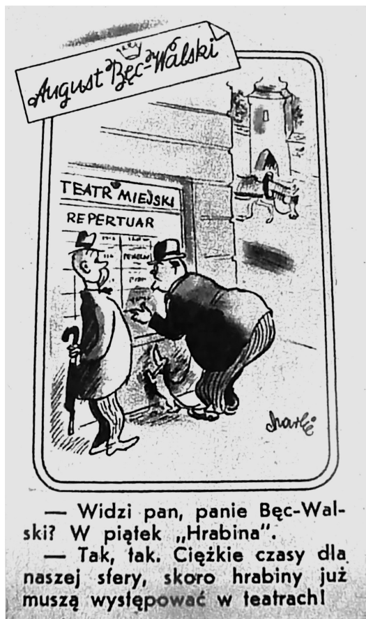
5. „Przekrój” 1945, nr 20.

Bardzo wymowny był także rysunek Jerzego Srokowskiego 67 , który ukazał się w „Szpilkach” 19 grudnia 1948 r. z nagłówkiem „15 grudnia 1948 r.” (odbył się wtedy kongres zjednoczeniowy PPR i PPS). Na rysunku widoczne są trzy postacie, które słuchają radia, nie trudno się domyśleć jakiego, i bez entuzjazmu spoglądają w okno na tłumy idące w pochodzie. Mamy w tym przypadku skrajne reakcje na fakt zjednoczenia, rozumianego także szerzej, z jednej strony masową