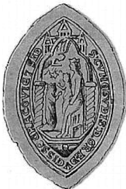
2. Po lewej: odrzys rzekomej pieczęci Sandomierza (według: M. Baliński, T. Lipiński, Starożytna Polska, t. II, s. 269); po prawej: odrzys pieczęci Kingi na podstawie egzemplarza z 1266 r. (według: T. Żebrawski, O pieczęciach dawnej Polski i Litwy, Kraków 1865, s. 26, tab. 4, nr 13). Zestawienie według: M. Starzyński, Uwagi w sprawie genezy, s. 33.