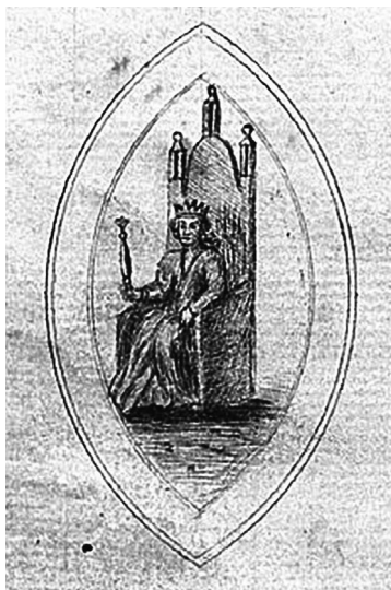
1. Odrzys rzekomej pieczęci Sandomierza w kopiarzu, powstały zapewne przed połową XIX w. (według: T. Giergiel, R. Jop, Dokument lokacyjny, s. 27).