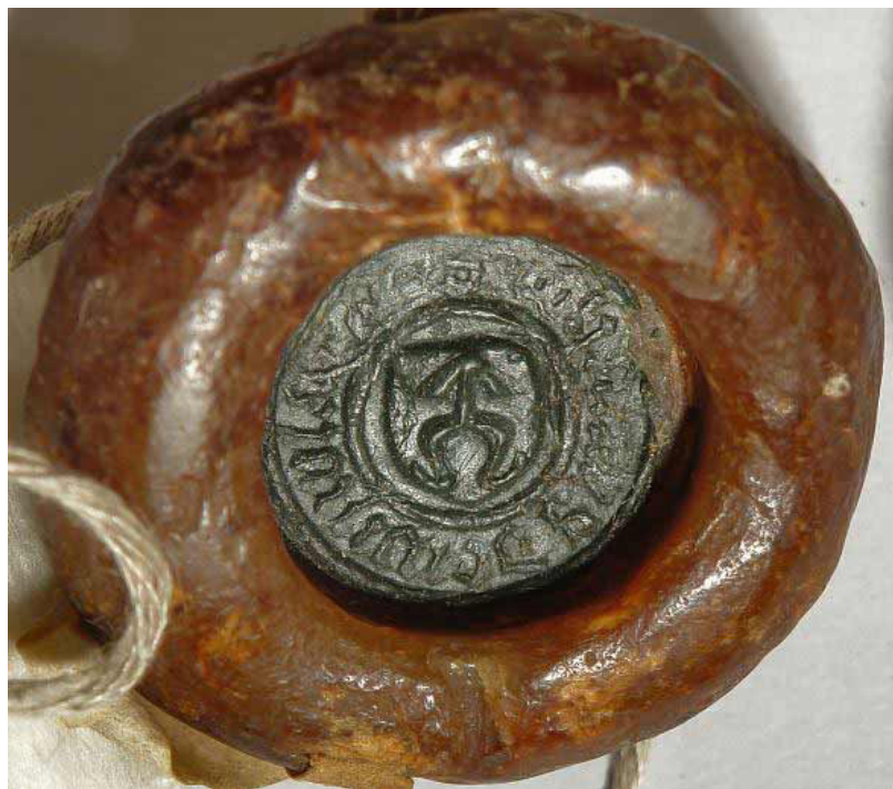
Fot. 3. Pieczęć niezidentyfikowanego dysponenta herbu Odrowąż