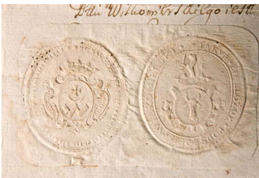
Il. 4. 1731 r., wypis z ksiąg wilkomierskiego sądu ziemskiego z pieczęciami sędziego i podsędka; B. Uniwersytetu Wileńskiego, RS, f. 5-A28-4975