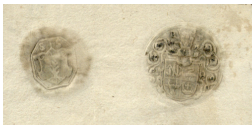
Il. 2. 1586 r., wypis z ksiąg oszmiańskiego sądu ziemskiego z pieczęciami sędziego i podsędka; B. Wróblewskich, RS, f. 16–77, k. 150