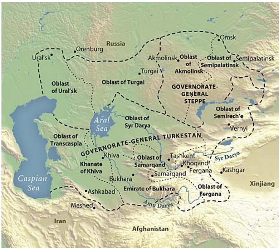
Mapa 3. Azja Centralna w czasach Imperium Rosyjskiego