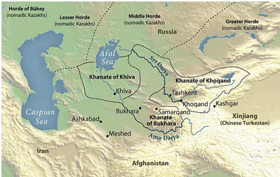
Mapa 1. Azja Centralna około 1815 roku