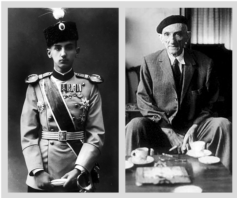
4a–b. Kontrasty. Następca tronu w Królestwie Serbii Jerzy z Karadziordziewiców w 1909 r. oraz mieszkaniec komunistycznej Jugosławii zapomniany Jerzy na kilka lat przed śmiercią

przede wszystkim kompromitację Karadziordziewiców i międzywojennego systemu władzy w Jugosławii.