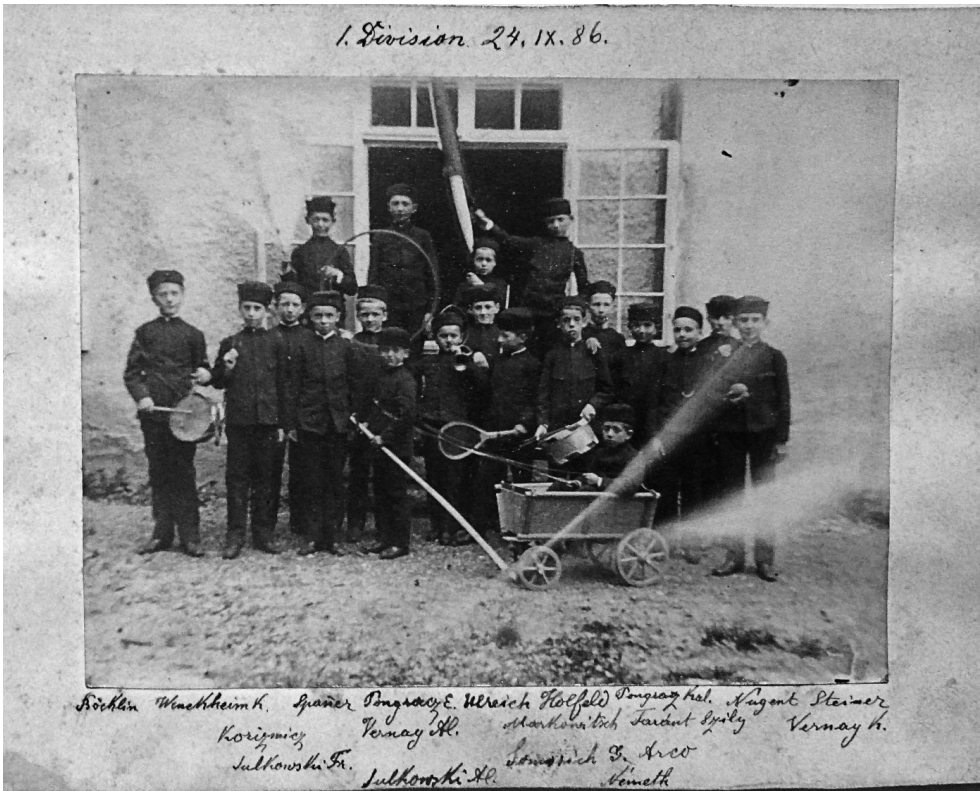
Zdjęcie 10: Członkowie Oddziału 1 w dniu 24 września 1886 r., w tym dwóch członków rodziny księcia Sułkowskiego