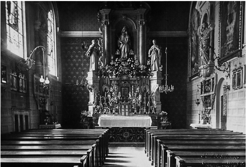
Zdjęcie 5: Kaplica zgromadzenia z obrazem Mater admirabilis (rok nieznany)