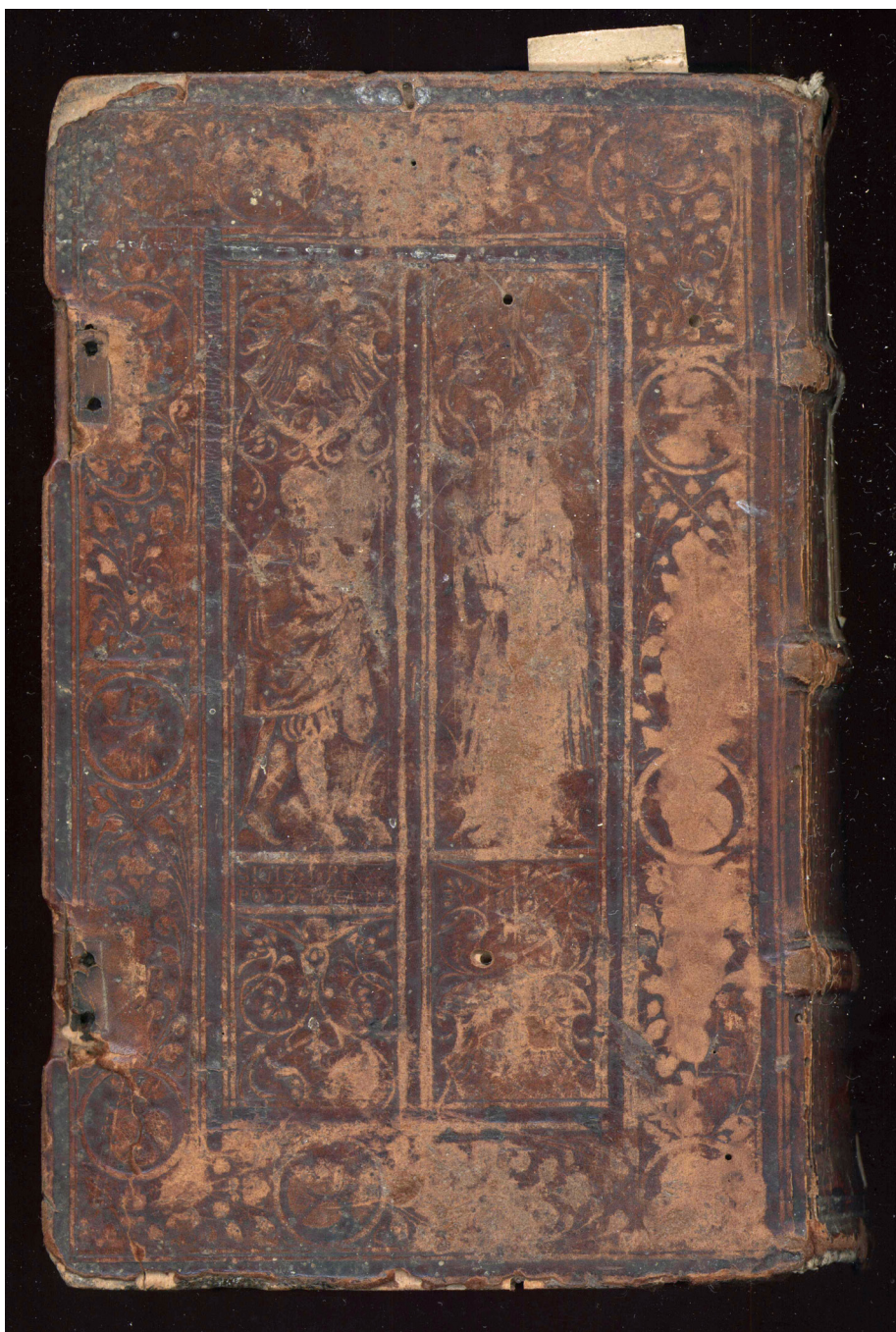
Il. 2. Dolna okładzina oprawy starodruku z 1535 roku