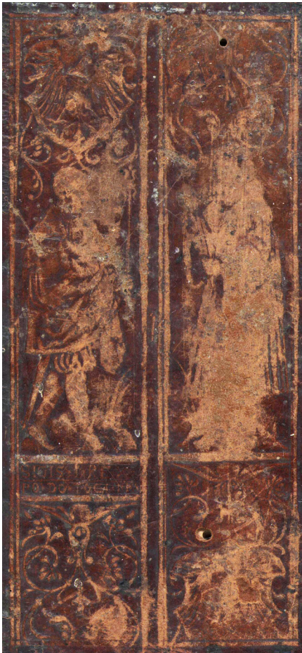
Il. 3. Wyciski pełnopostaciowego radełka jagiellońskiego na dolnej okładzinie starodruku z 1535 roku

spodnie do pół uda, tzw. pluderhose. W lewej ręce trzyma długie berło zwieńczone stylizowanym motywem lilii, natomiast spod szat wyłania się pochwa bliżej nierozpoznanej broni białej. Nad głową opisywanej osoby widnieje opleciona arabeską tarcza turniejowa tzw. polska z Orłem Białym i przypuszczalnie z cyfrą S (wyobrażenie litery jest mocno zatarte). Poniżej postaci umieszczono prostokątną ramę z dwuwierszową inskrypcją: SIGIS I REX / PO DO [...] PR[...] , pod którą znajduje się motyw arabski stanowiącej już element kompozycji następnego wizerunku. Na prawym wycisku radełka widać natomiast słabo rozpoznawalną osobę zwróconą w prawo, w długiej powłóczystej szacie, z berłem w lewej ręce. Powyżej oraz poniżej postaci umieszczony jest motyw arabski. Pod dolną arabeską powtarza się wycisk opisywanej wyżej tarczy turniejowej z Orłem Białym oraz przypuszczalnie z cyfrą S, co dowodzi, że omawiane radełko zawierało wyobrażenia jedynie dwóch postaci.