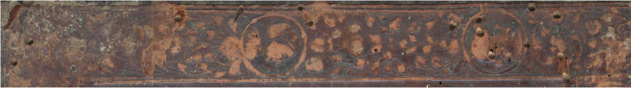
Il. 5. Wycisk radełka z medalionami popiersiowymi na dolnej okładzinie oprawy starodruku z 1539 roku

sygn. BS 4665.