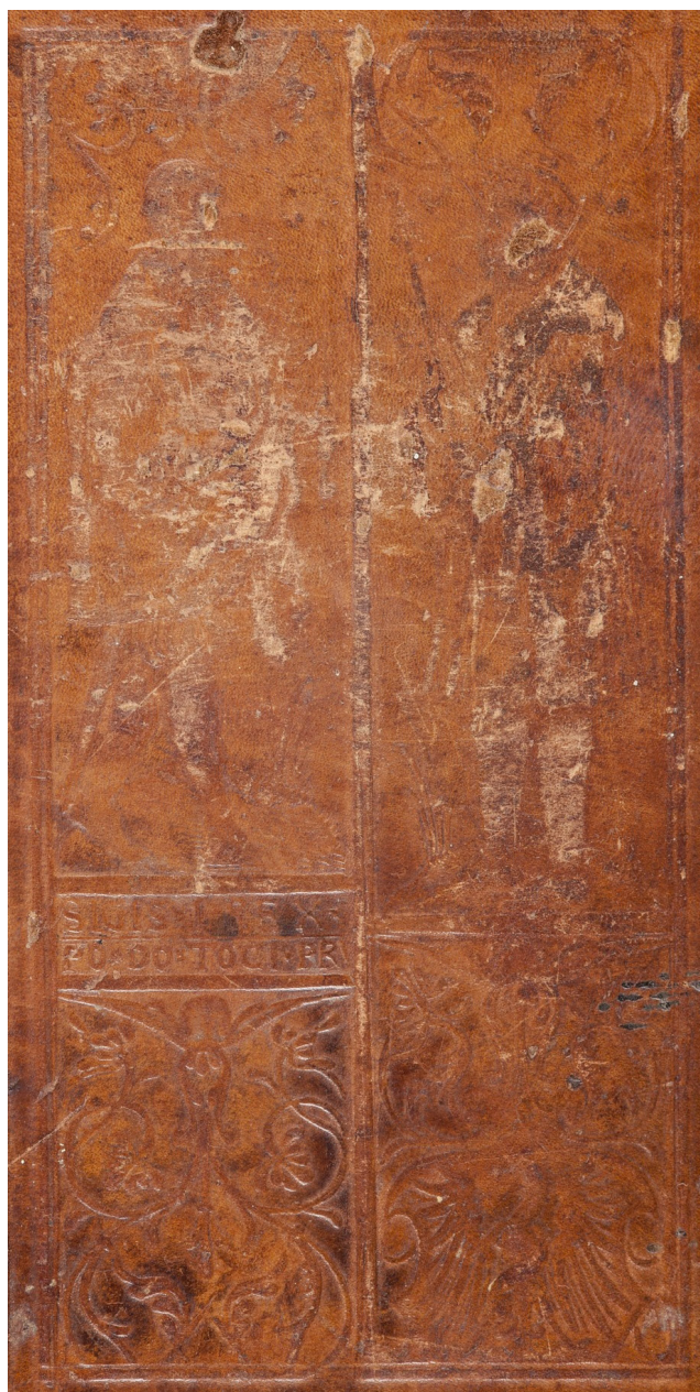
Il. 4. Wyciski pełnopostaciowego radełka jagiellońskiego na oprawie starodruków z 1540 i 1541 roku