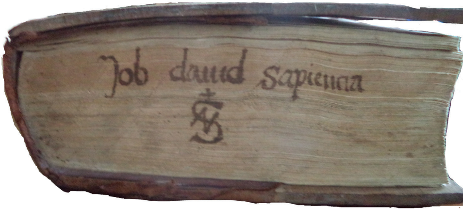
Il. 2. Inc. 3098–3100, dolne obcięcie