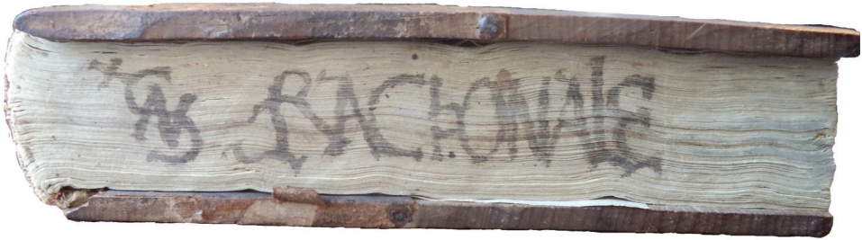
Il. 1. Inc. 394, dolne obcięcie – znak własnościowy Stanisława Smoły z Wolborza

i pięć dzieł wydanych w XVI wieku 15 . Woluminy w charakterystyczny sposób opatrywał skrótami tytułów dzieł i swym monogramem, które to umieszczał na obcięciach bloku. Na przełomie XVI i XVII wieku większość księgozbioru Stanisława przejął Szymon, zakrystian katedry krakowskiej, który darował go bibliotece augustianów (świadczą o tym kolejne wpisy własnościowe w księgach). Stamtąd zbiór trafił do zasobów Biblioteki Jagiellońskiej.