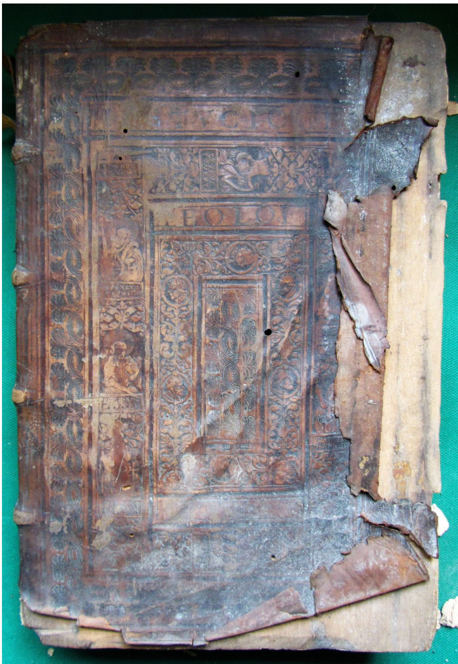
Il. 1. Oprawa druku z 1558 roku (górna okładzina), introligator MC lub Melchior Nering