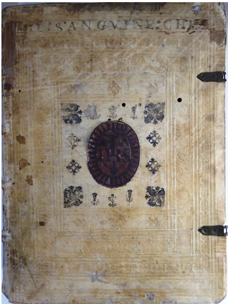
Il. 4. Wycisk plakiety z monogramem IHS w otoczeniu motywów floralnych na oprawie starodruku z 1617 roku (górną okładziną)