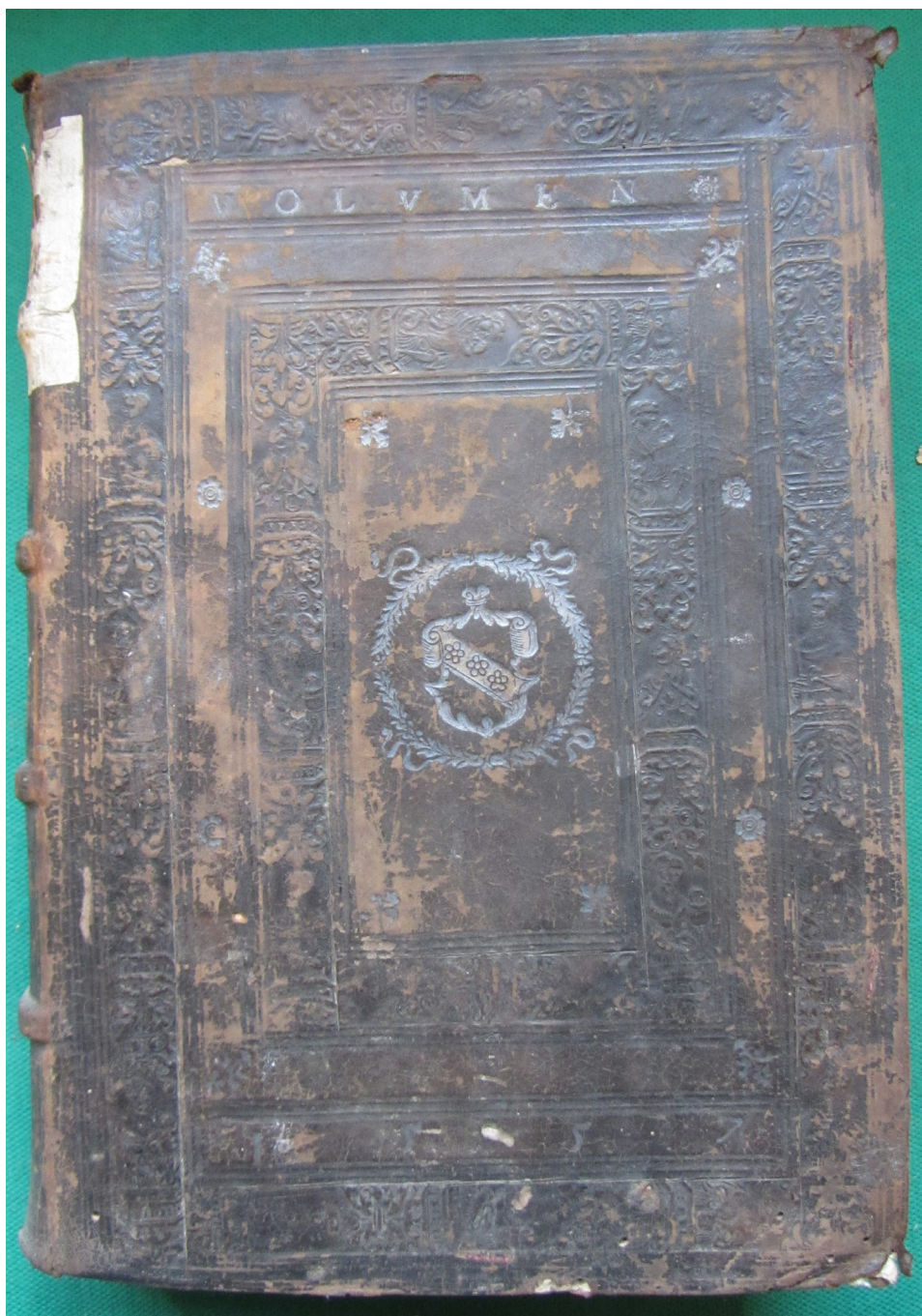
Il. 2. Oprawa druku z 1551 roku (górná okładzina), introligator krakowski (?)