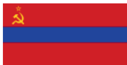
Flaga Armeńskiej SRR

Ostatni rozdział konstytucji ustanawiał herb i flagę Armeńskiej SRR.