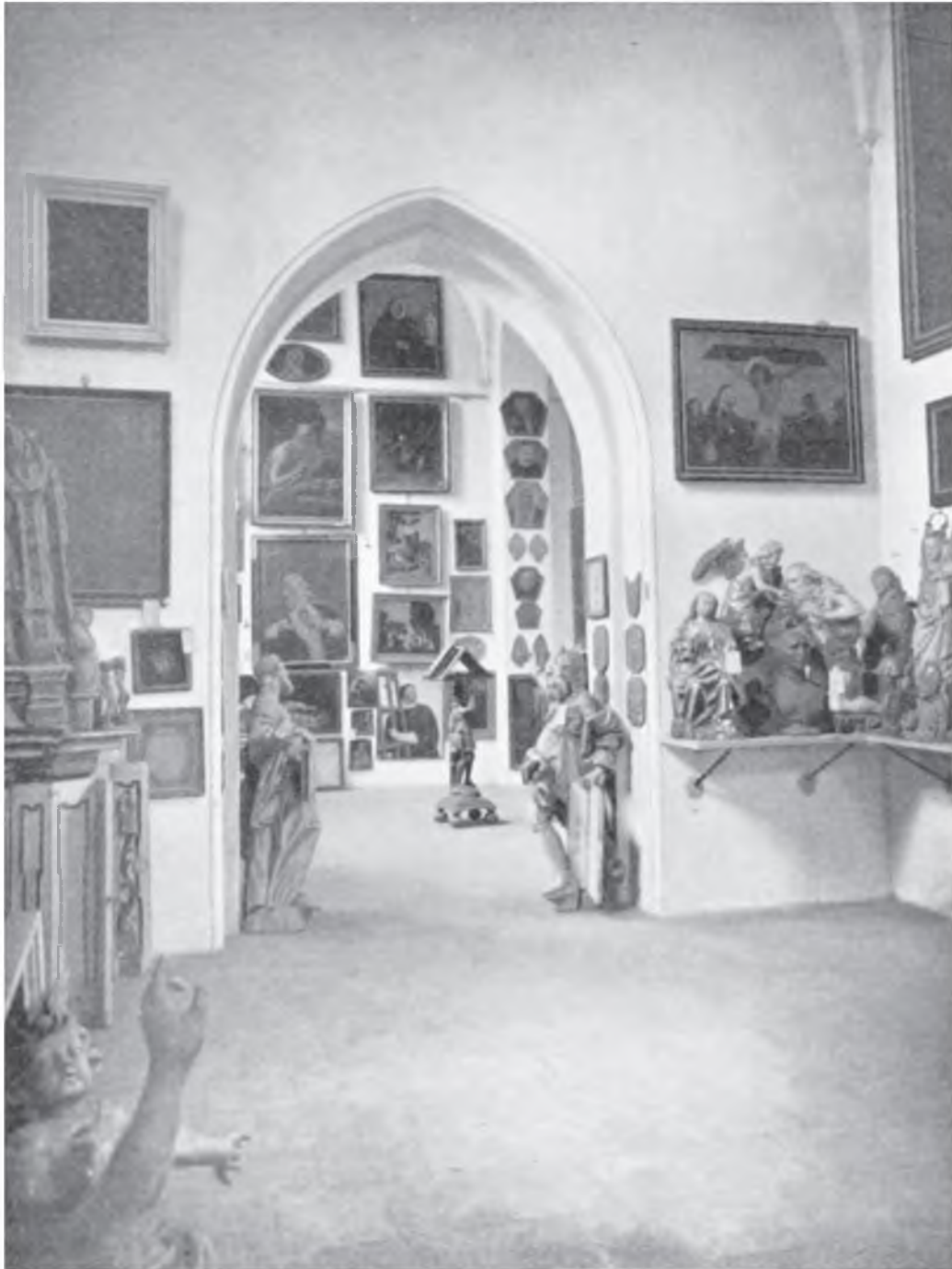
II. 2. Południowa ściana kaplicy oraz wgląd w nawę główną