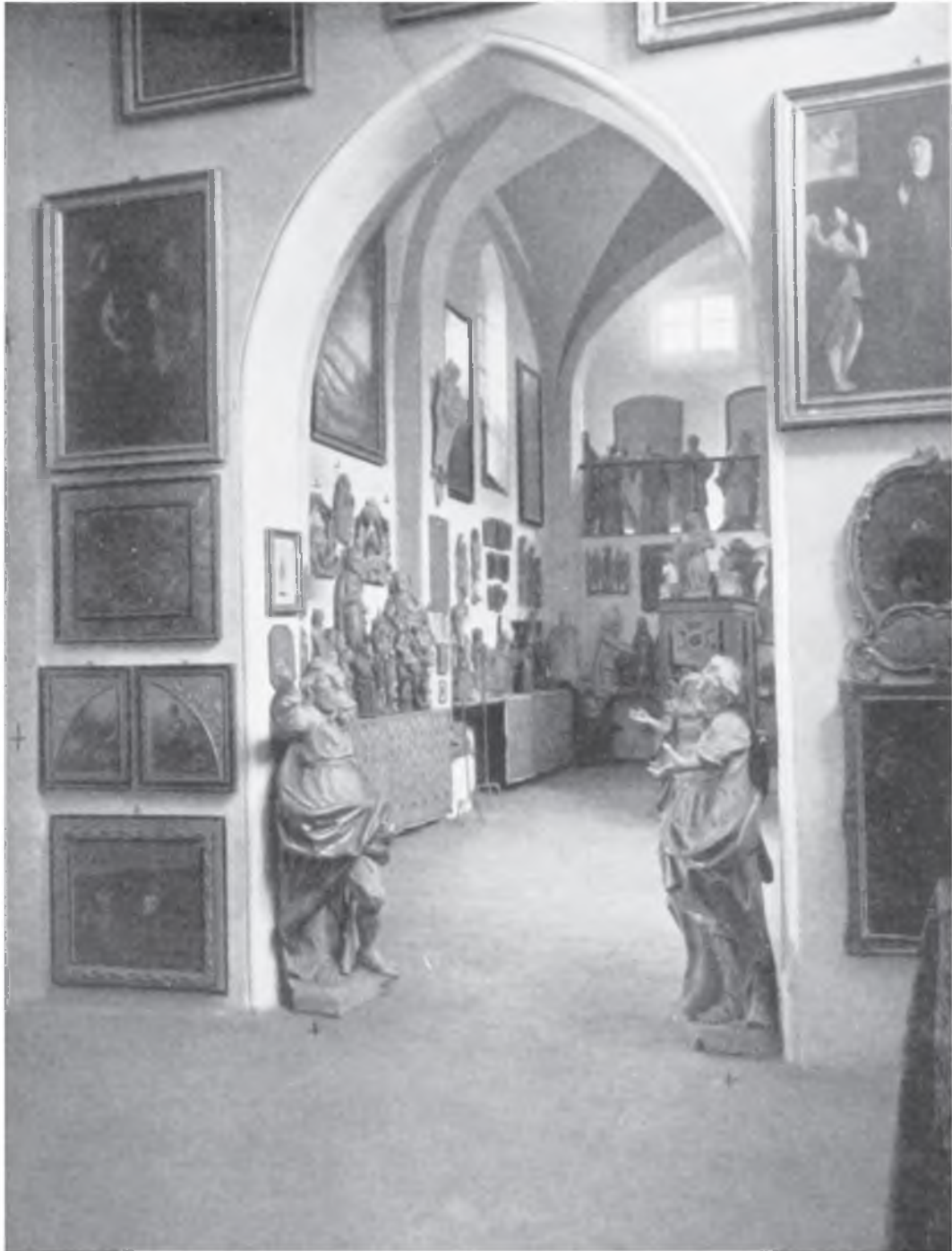
Il. 4. Widok z nawy głównej na zachodnią ścianę kaplicy