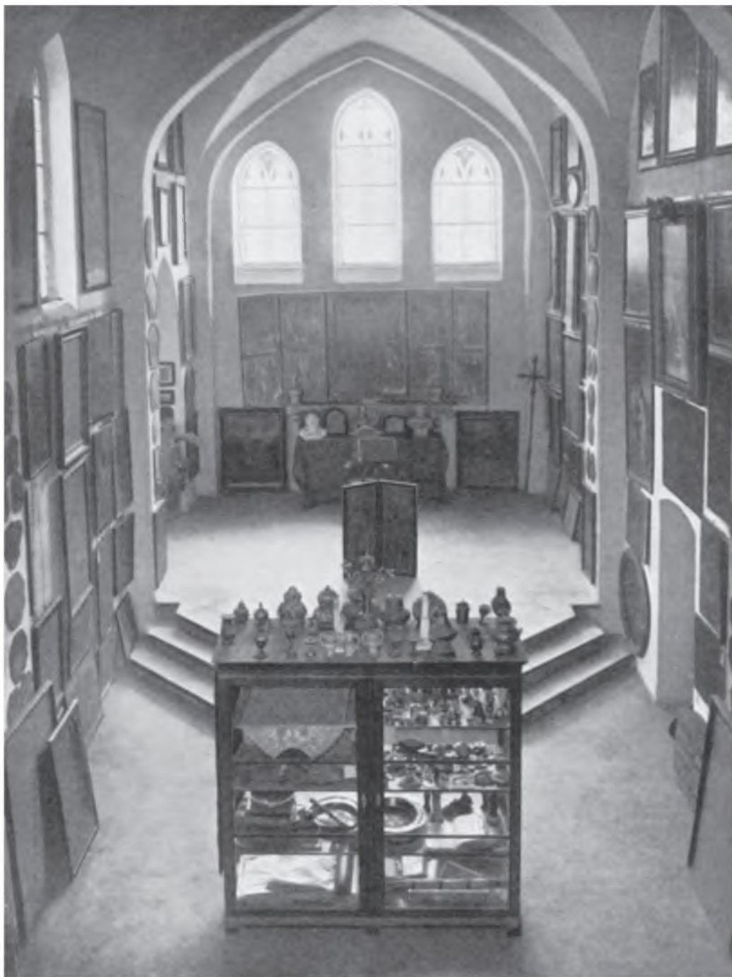
II. 3. Widok z zachodniej empory na nawę główną