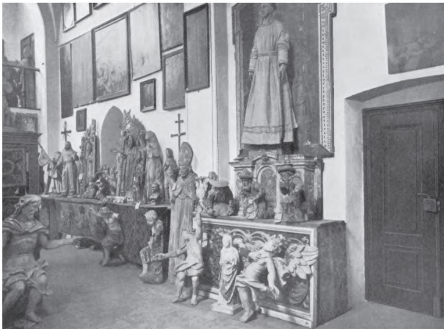
Il. 1. Wschodnia ściana kaplicy